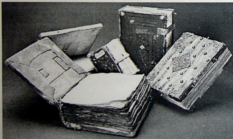
Рукописи в переплете