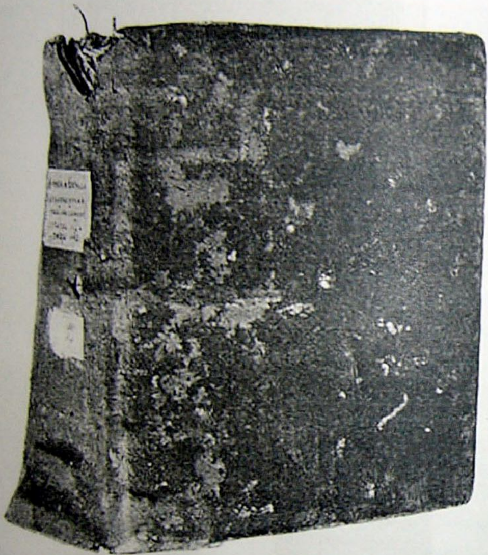
Кожа, XII в.