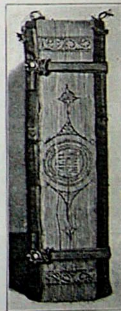
Обрез (2, 3)