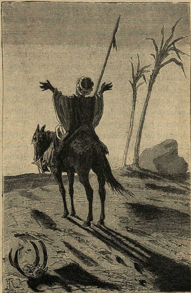
Арабъ на молитвѣ.