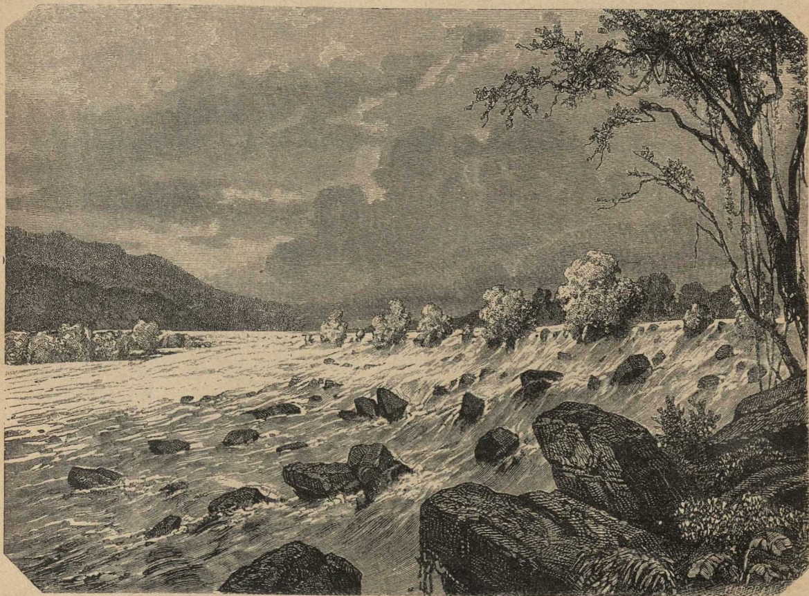
Пороги на рѣкѣ Нилѣ, въ Африкѣ.

Затѣмъ дама вошла въ гостиницу, заняла комнату и стала горько рыдать. Наплакавшись досыта, выплакавъ все свое горе, она прижала платокъ къ глазамъ и такъ и просидѣла, точно въ забытѣ, нѣсколько минутъ.