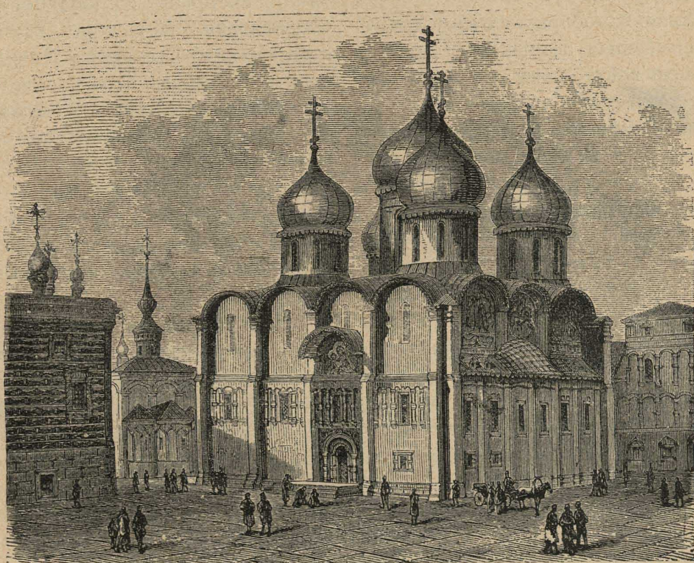
Успенскій соборъ въ Московскомъ Кремлѣ.

какъ можно скорѣе! Панъ Буркевичъ велѣлъ передать вамъ, что русскіе одержали надъ нами побѣду. Они уже выгнали наше войско изъ Москвы, очистили всю Московію отъ поляковъ и теперь уже выбрали себѣ своего природнаго царя!..