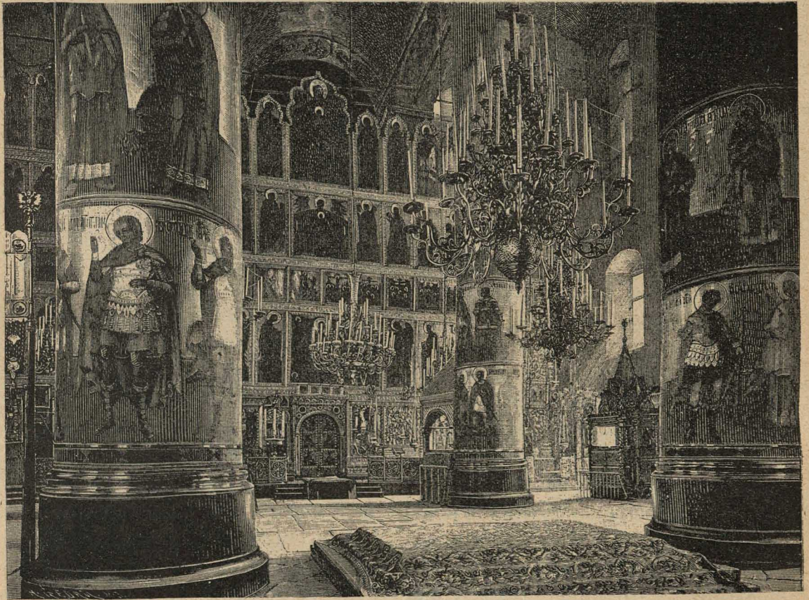
Внутренность Успенскаго собора въ Москвѣ.

по горамъ и доламъ и рѣшили наконецъ найти себѣ проводника. Судьба забросила ихъ въ далекое Дѣмино. Они знали, что оно принадлежало Романовымъ, знали, что царь-Михаилъ долженъ былъ быть