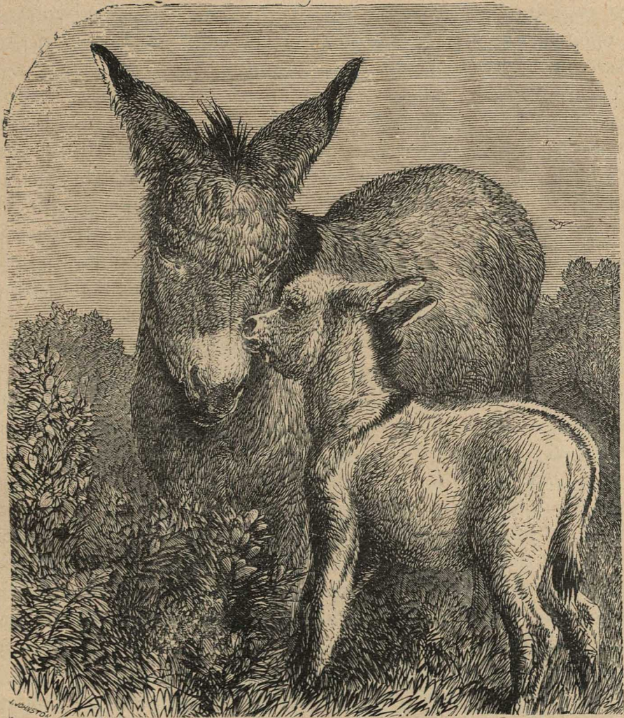
Л а с к и.

казалось, было странно его услышать, показался дамѣ прекрасной музыкой, которой она не слышала уже давно. И полная нѣжности къ этой чужой, незнакомой ей дѣвчкѣ,