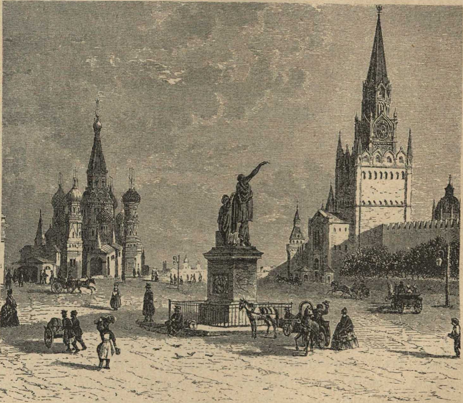
Памятникъ Минину и Пожарскому и Спасскія ворота въ Москвѣ.

Загремѣлъ оркестръ, снова зазвенѣли шпоры и ловкіе польскіе офицеры и прекрасныя воздушныя панны снова закружились