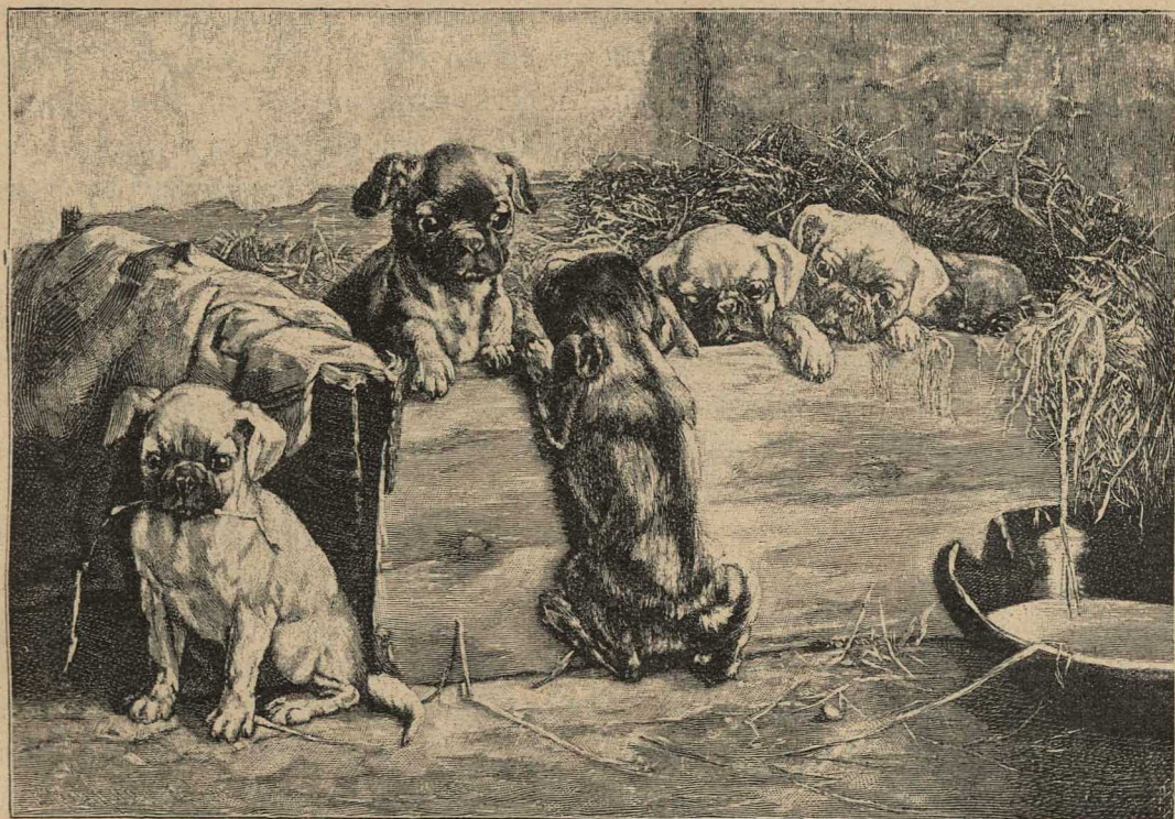
Скоро-ли вернется мать?

Стала заниматься заря. Ваня вспомнилъ о ней, вспомнилъ о томъ, что говорилъ ему его пріемный отецъ, когда посылалъ его въ мона-