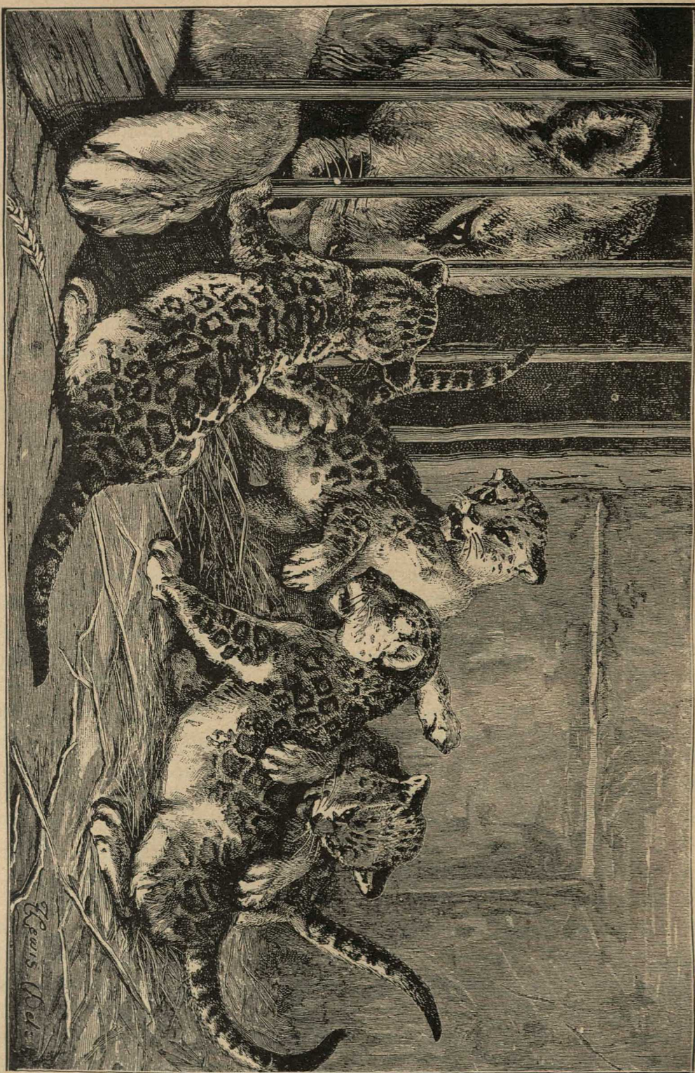
Къ. пятной матери подпустили въ дѣтѣи.