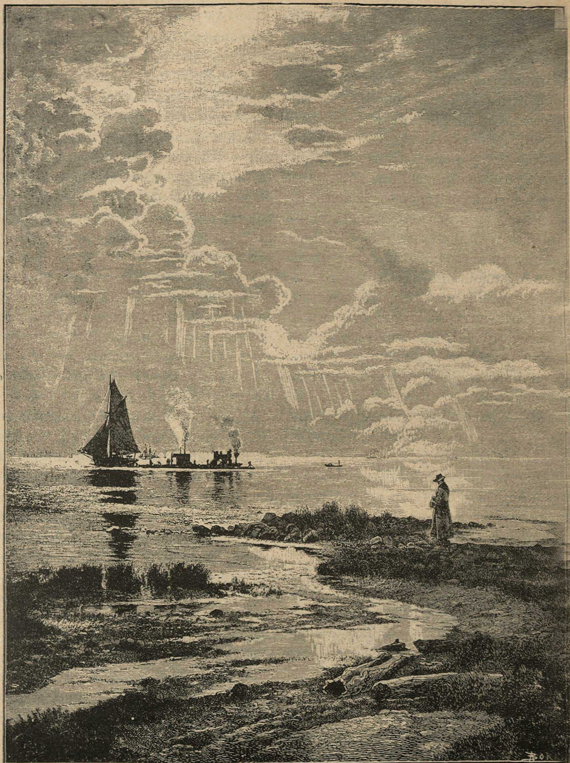
У береговъ Даніи.