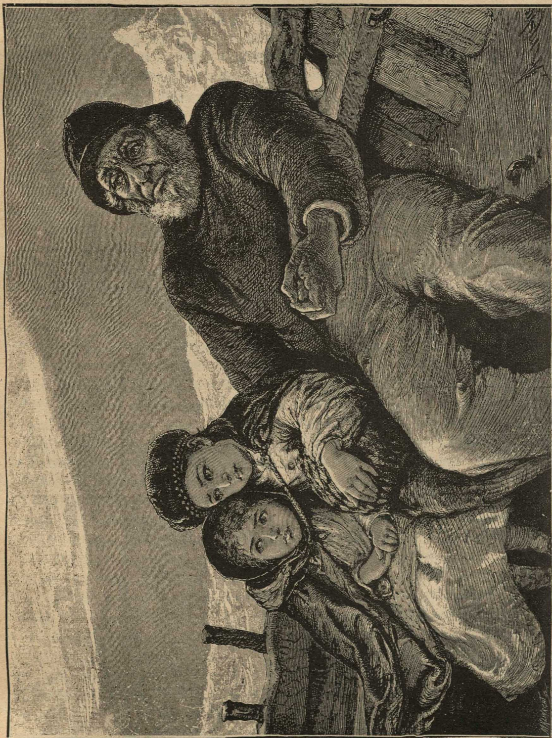
Съ дѣдушкой въ лодкѣ.