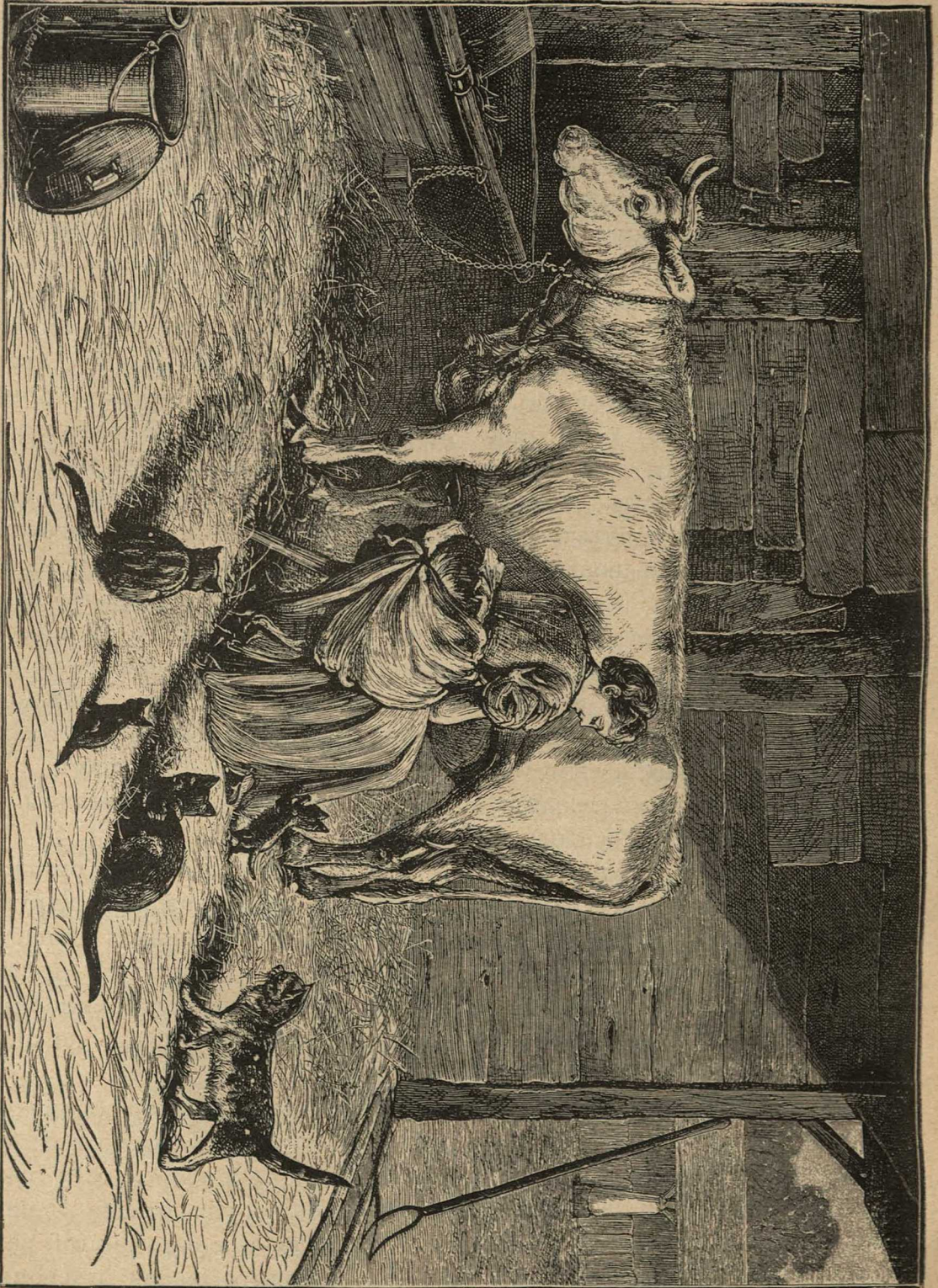
Въ ожиданіи молока.