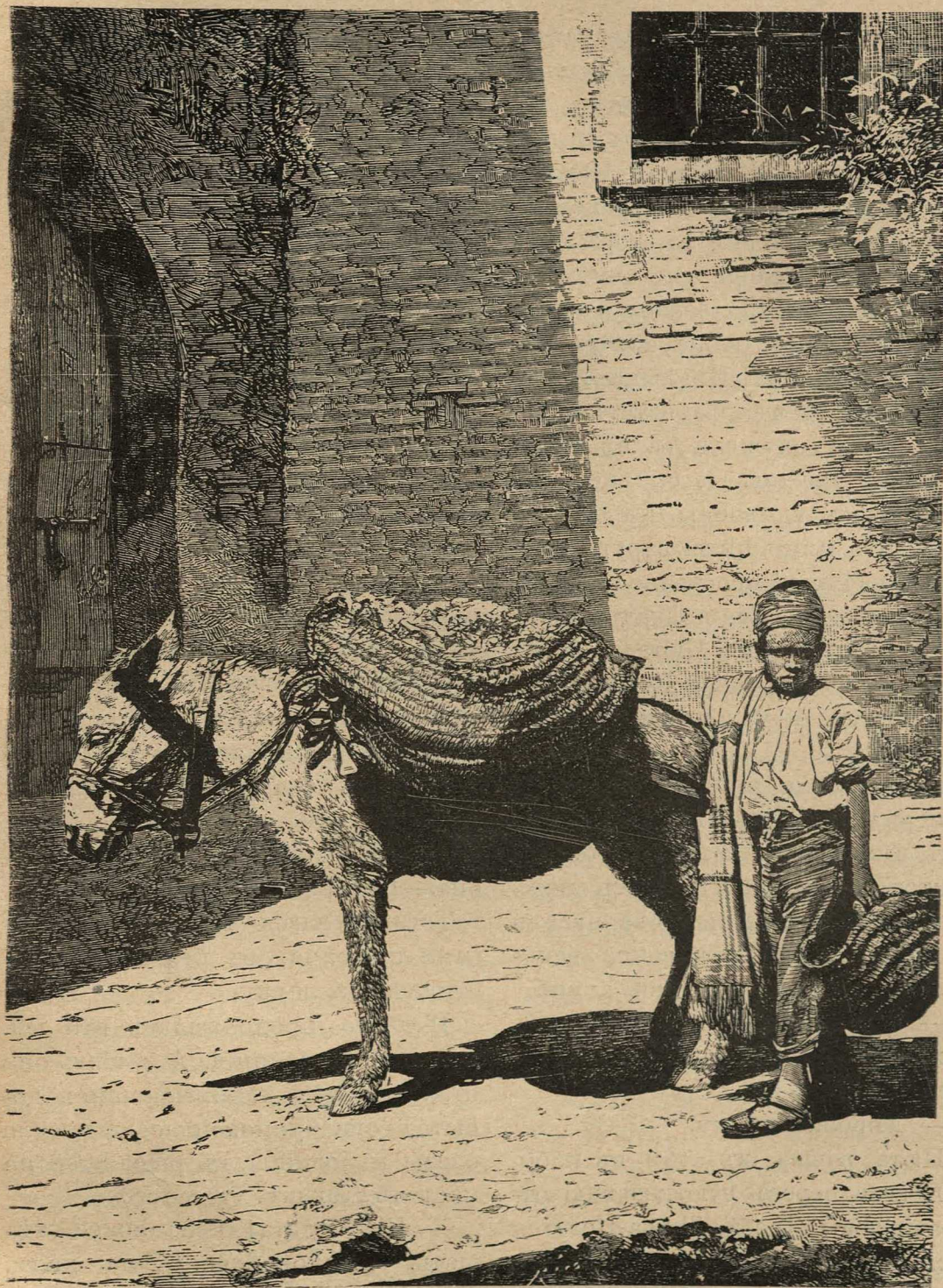
Продавец овощей в Каирѣ.

(Отъ солнца овощи въ корзинѣ прикрыты сверху травой).