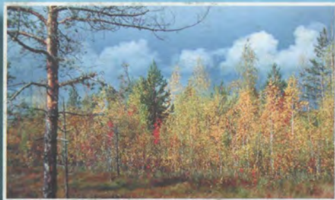
Леса у западных предгорий