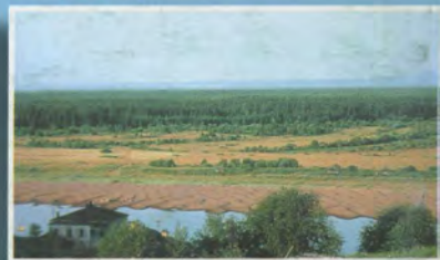
Полюдов кряж на западных предгорьях