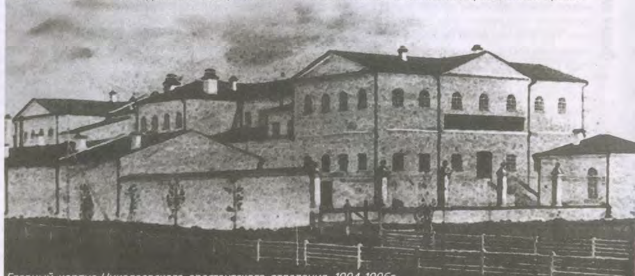
Главный корпус Николаевского арестантского отделения. 1904-1906г. Из фондов нижнетуринского краеведческого музея.

О деятельности отделения в годы революции и в начале гражданской войны практически ничего неизвестно. По амнистии, проведенной Времен-