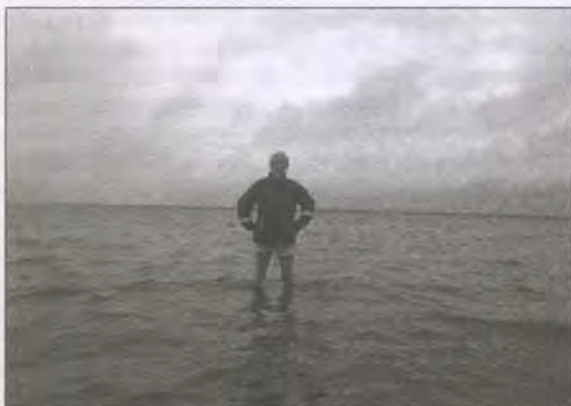
«Добрые полуплутники «Уральского следопыта»»

озера, поскольку слово «туман» в мансийском языке обозначает широкий разлив реки и к русскому «туману» отношения не имеет, хотя в дождливую пору озеро действительно окутывает плотная пелена тумана. Став озером, Пелым сохранил все особенности водного режима, свойственные реке, поэтому сезонные изменения уровня воды здесь особенно заметны. В весеннее половодье вода поднимается на 4 – 5 метров, заливая прибрежные болота и леса. В это время на озере бывают шторма с высотой волн до двух метров, и горе тому рыбаку или туристу, кого занесет в это время сюда «нелегкая». Летом ситуация резко меняется. Мелеет Пелым – мелеет и озеро. Насколько сильно оно мелеет, нам пришлось убедиться на собственном опыте. Влетев на полной скорости из Пелы-