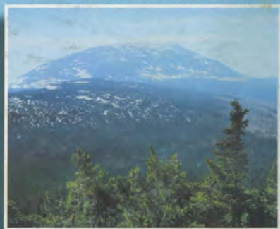
Кедры и ели на склоне Конжака