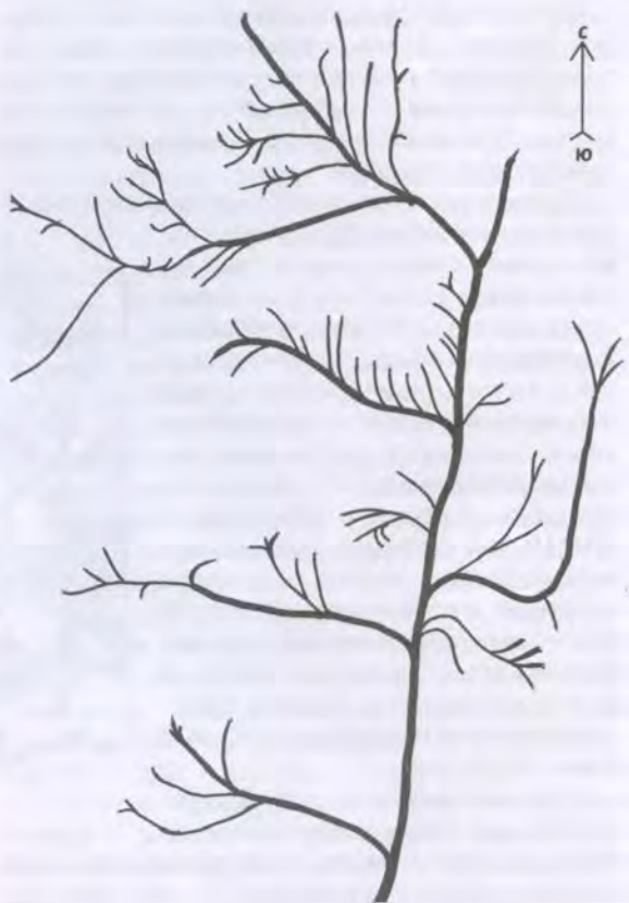
Схема ветвистости лога в городском лесу, выходящего в долину р. Сарапулки в р-не стоянки древнего человека «Кладовая веретя».

Здесь все было так, как описано в Межевой книге: «...перешед ручей, боровой овраг, Стрелковый лог и два отвершка безымянные – направо лес, градской, города Сарапула». Мы как будто бы оказались в XIX столетии. Лес сохранил нам и Стрелковый лог.