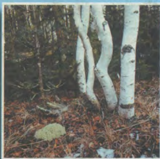
Березки и кедр в предгорьях Конжака

Начало серии заметок «Леса Уральской горной страны» в №2 за 2004год.