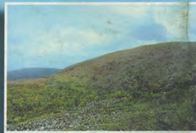
Подгольцовая и гольцовая зоны на Чистопе