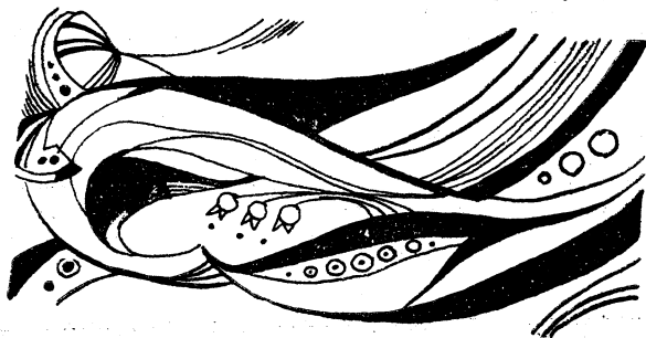
Рисунок Татьяны Худобородовой

Не оглашает птиц веселый лепет Рождение дня, встающего во мгле... Сплетение ветвей в озябшем небе — Как трещины на лопнувшем стекле. Пылают листья, облетев к ногам, Но тушит дождик жар костров пунцовых, В нечетком отраженьи вод свинцовых Задумчивы и строги берега... Нет, все же есть своя неповторимость В текущем дне садов и берегов: И чистота, и мудрость, и... ранимость В преддверьи наступающих снегов.