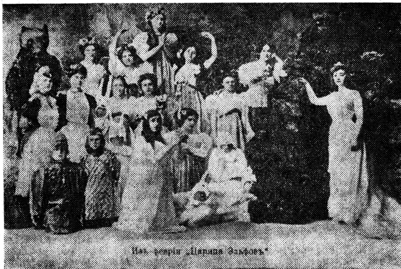
Из серии «Вера Павловна»

Надвигались октябрьские дни. Следом — гражданская война.