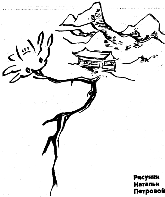
Рисунки Натальи Петровой