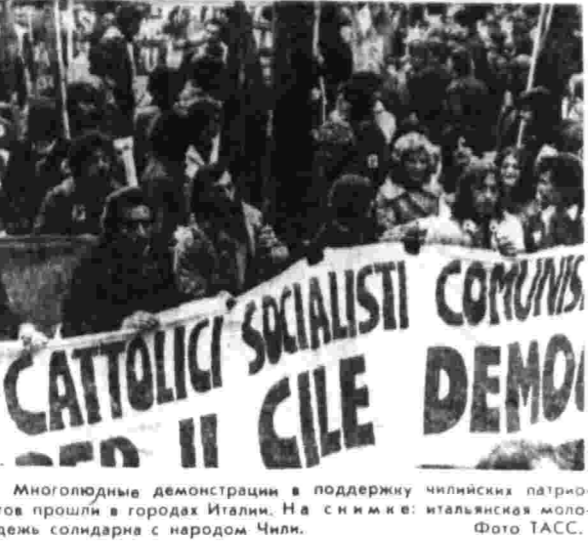
Многочисленные демонстрации в поддержку чилийских патриотов прошли в городах Италии. На снимке: итальянская молодежь солидарна с народом Чили.