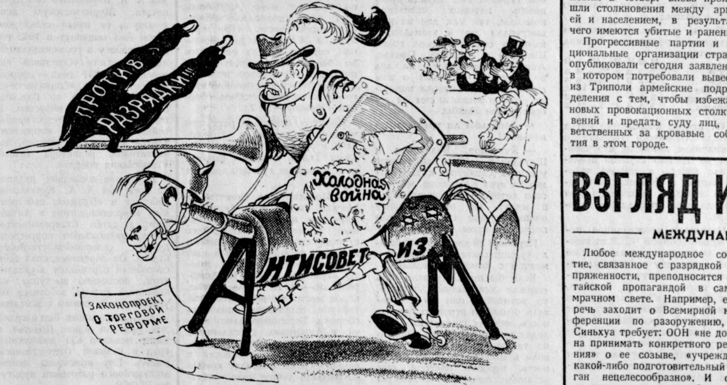
ГОРЯЧИЙ РЫЦАРЬ ХОЛОДНОЙ ДАМЫ. Рис. В. Фомичева.