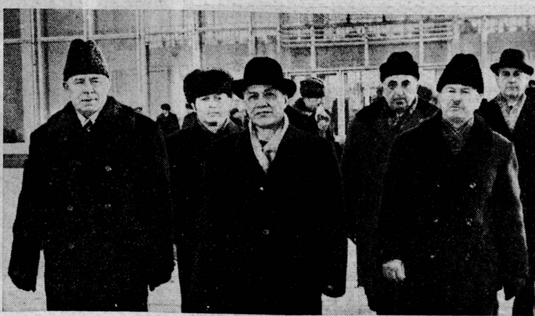
Проводы на Внуковском аэродроме.

ЛОНДОН, 21. (ТАСС). Экономический кризис, с которым столкнулась сейчас Англия, самым непосредственным образом связан с ее вступлением в «общий рынок» — такое мнение ряда английских экономистов и печати. В результате присоединения Великобритании к замкнутой западноевропейской экономической группировке ее внешнеторговый дефицит стал «катастрофическим». Только за 11 месяцев текущего года он составил в торговле с другими странами ЕЭС более 950 миллионов фунтов стерлингов — почти в два раза больше, чем в прошлом году.