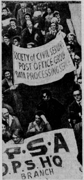
АНГЛИЯ. Политика «замораживания» заработной платы...

Обсуждены пути углубления специализации на основе международного социалистического разделения труда в сельском хозяйстве.