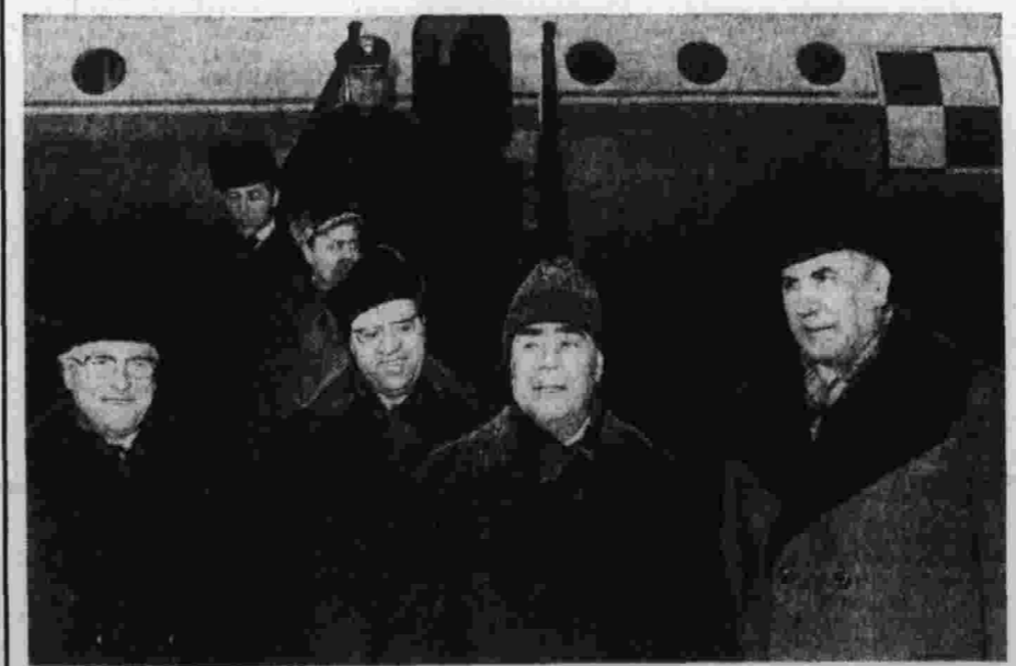
Встреча на Внуковском аэродроме.