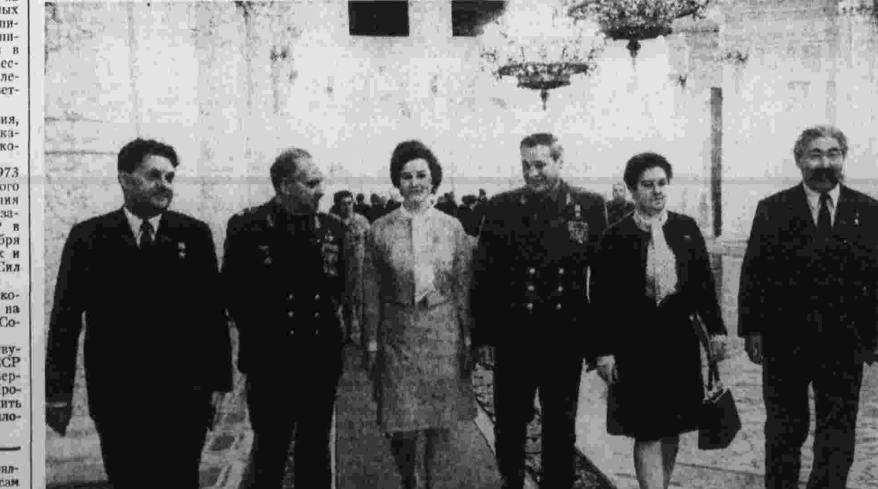
Москва, Кремль, седьмая сессия Верховного Совета СССР восьмого созыва. Группа депутатов в Георгиевском зале Большого Кремлевского дворца.

налога с доходов, получаемых гражданами от кустарно-ремесленных промыслов»;