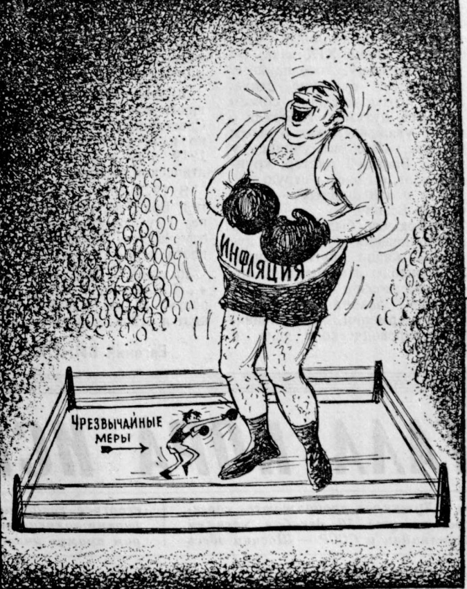
НЕРАВНЫЕ СОПЕРНИКИ. Рис. Д. Агаева.

Все больше американцев на горном опыте убеждаются, что никакие «чрезвычайные меры» не могут избежать их от тягостного гнета инфляции. (Из газет).