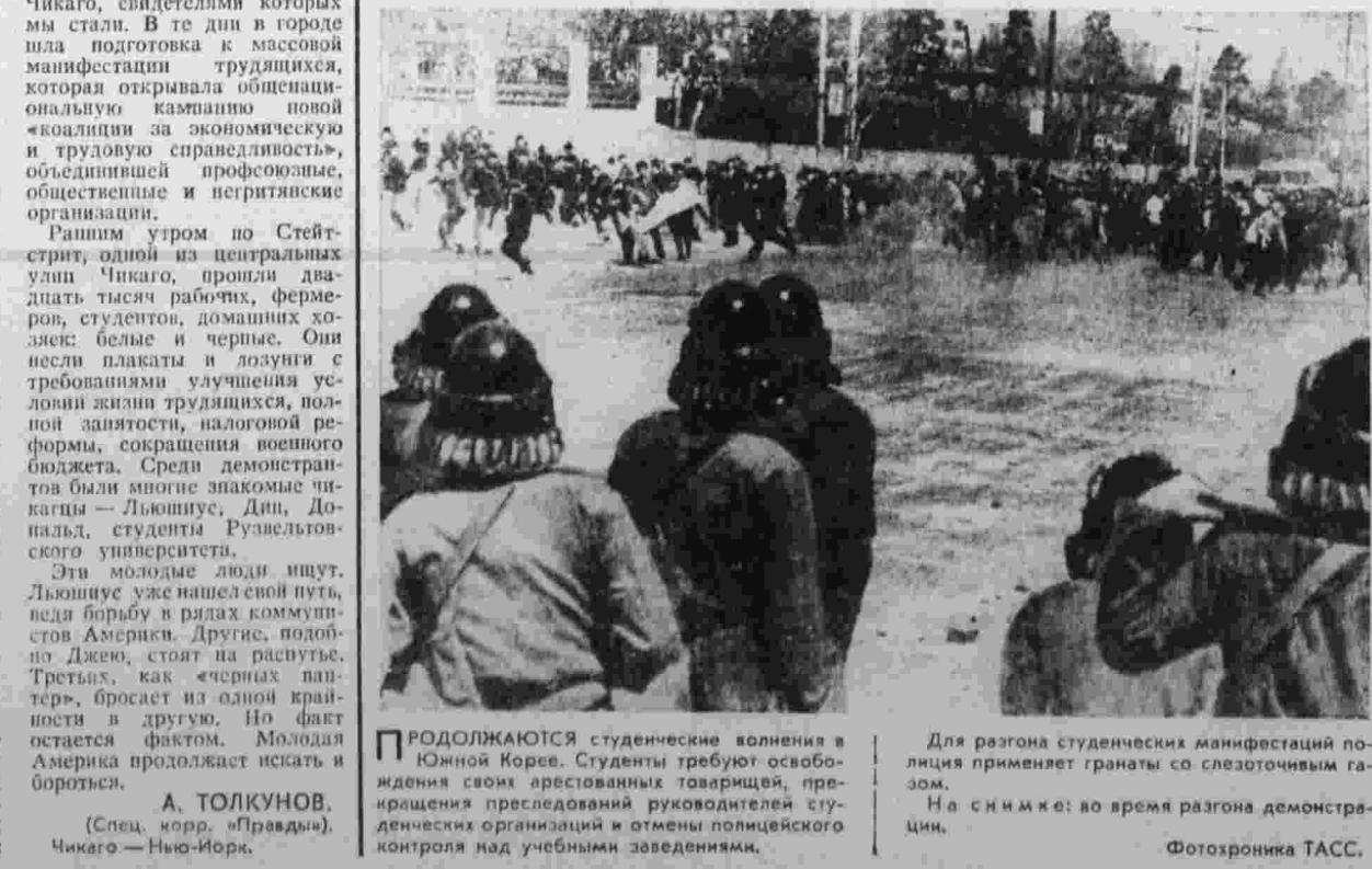
ПРОДОЛЖАЮТСЯ студенческие волнения в Южной Корее. Студенты требуют освобождения своих арестованных товарищей, прекращения преследований руководителей студенческих организаций и отмены полицейского контроля над учебными заведениями.