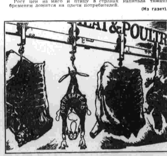
НА КРЮЧКЕ. Рис. из газеты «Квиздин трибуна».

СОФИЯ. Центральный Комитет Болгарской коммунистической партии потребовал немедленного освобождения арестованных прогрессивных политических деятелей Уругвая.