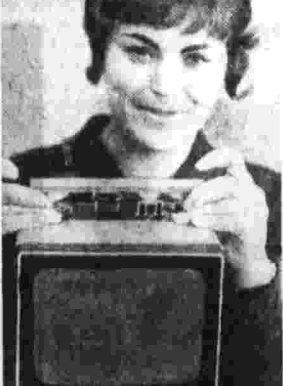
Новая модель портативного телевизора «Ризонда-М» с экраном 25 сантиметра по диагонали разработана в Ленинградском научно-производственном объединении «Поэтон».

В крупнейшем космическом универсаме «Детский мир» началась торговля сложными игрушками и новогородскими подарками.