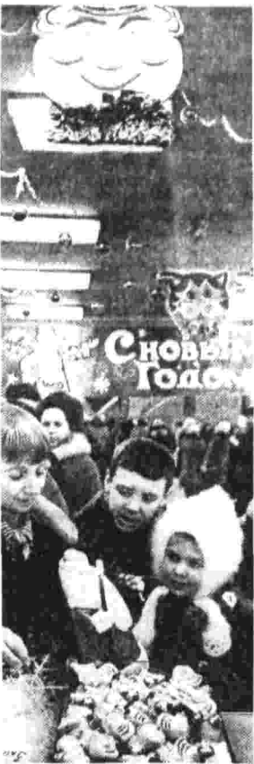
Снова Годовые ярмарки в Киеве.

произведенные данные учитываются при составлении заказов промышленности. Сейчас мы ясно представляем программу на пятилетку по большому числу товаров. Прямательно, что есть возможность уже в ближайшие время полностью удовлетворить спрос на такие вещи длительного пользования, как телевизоры, холодильники, стиральные машины и т. д. Одной из форм активного воздействия торговли на промышленность стали республиканские оптовые ярмарки. В этом году они проведены в соответствии с требованиями плана и фабрики, составили производственный план на четвертый год пятилетия, могли полнее учесть запросы торговли. Надеемся получить от промышленности в достатке предметы обихода и товаров длительного пользования, спрос на которые пока удовлетворяется не полностью. В их числе — кровати деревянные, кресла, подушки перьевые, электрочайники, много других изделий. В арсенале по мебели впервые участвовали текстильные предприятия, выпускающие ткани. Это дало возможность отобрать для мягкой мебели лучшие ткани. Почти три четверти выпускаемых в республике предметов культурно-бытового назначения и хозяйственного обихода приходится на долю предприятий тяжелой индустрии. Еще в начале пятилетки хорошую инициативу проявила коллектив Ждановского завода имени Ильича, заводско-харьковского — «Электротехника» и других. Они взяли на себя в действие все резервы для увеличения производ-