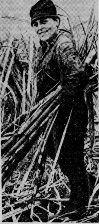
На Кубе в разгаре уборка сахарного тростника. Этот год значительно расширен плантации под эту культуру.

ВАРШАВА, 6. (Соб. корр. «Правды».) Новый химический гигант Народной Польши — комбинат «Полине» под Щецином — проломит наращивать мощност... В конце ноября завод введен в строй еще один завод фосфорной кислоты. Теперь комбинат располагает семью предприятиями, которые ежегодно будут выпускать более полутора миллионов тонн серной и фосфорной кислоты. «Полине» становится крупнейшим в стране производителем высококонцентрированных минеральных удобрений. Расширяются и другие центры «большой химии» республики. Новое предприятие и установка сданы в этом году в экс... платацию на комбинатах в Освенциме, Кендзежине, Бялохове, Пойске. Ударными темпами сооружаются нефтеперерабатывающий завод в Гданьске. В соответствии с решением Политбюро ЦК ПОРП и правительства в стране разработана программа химизации народного хозяйства. Только в нынешнем году на предприятиях химической промышленности основан выпуск около 500 новых видов изделий широкого спроса. Б. АВЕРЧЕНКО.