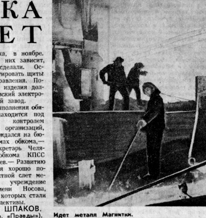
Идет металл Магнитки.