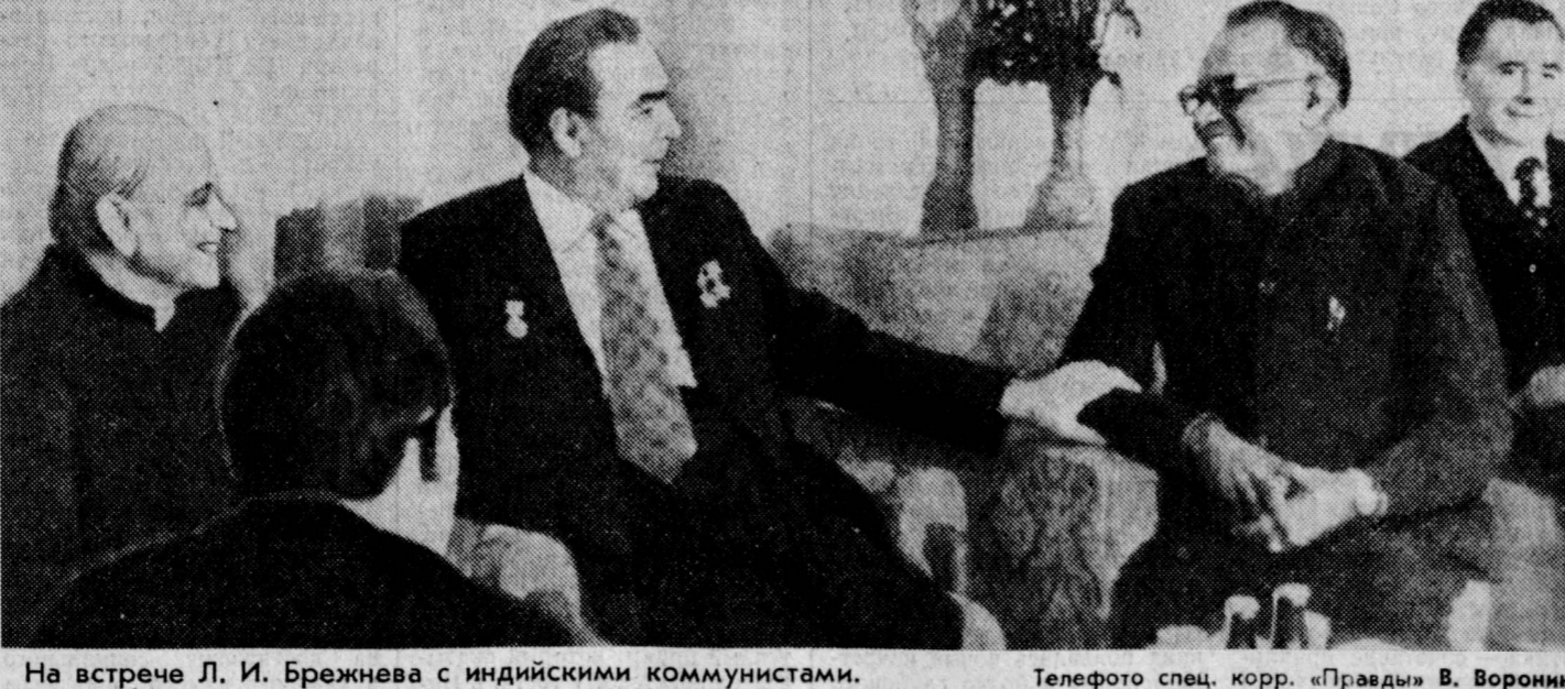
На встрече Л. И. Брежнева с индийскими коммунистами.

участие в проходящих в столице собраниях и митингах, посвященных визиту советского гостя.