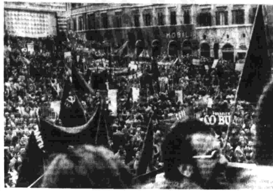
Антифашистская манифестация в Перудже.

27 ноября в посольстве КНДР в Советском Союзе состоялось совещание в связи с обсуждением на Генеральной Ассамблее ООН корейского вопроса.