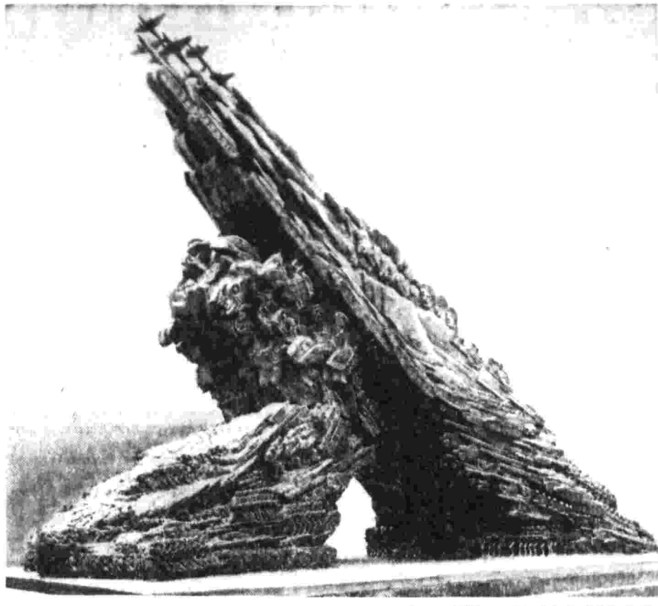
Вознесен над фигурой фашиста с автоматом на груди. Низко на глаза надвинута маска. В слепой злобе он еще не чувствует гибели...