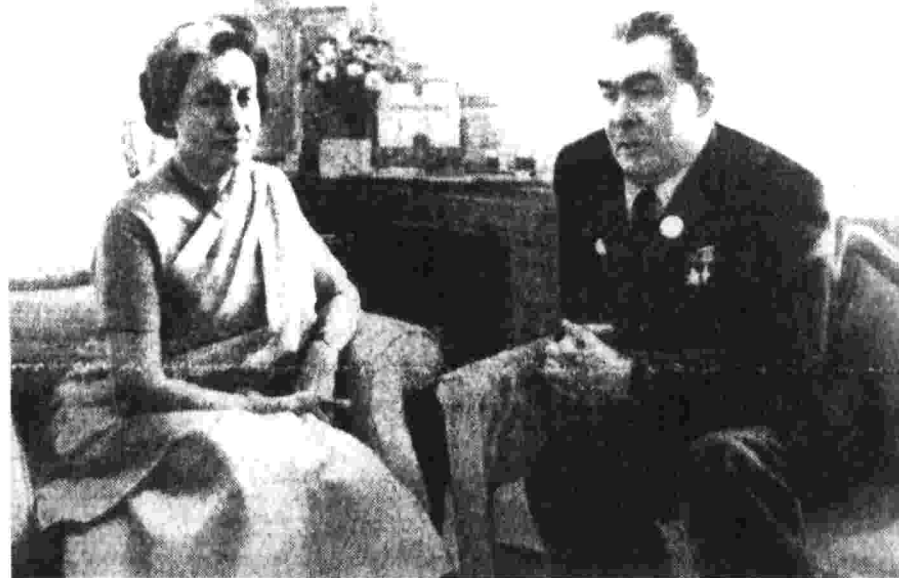
Во время беседы Л. И. Брежнева с Индирой Ганди.