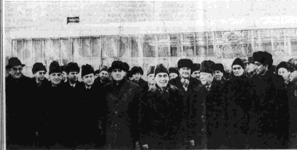
Проводы на Внуковском аэродроме.

На площади и улицах Ташкента тысячи жителей столицы республики сердечно приветствовали Леонида Ильича Брежнева.