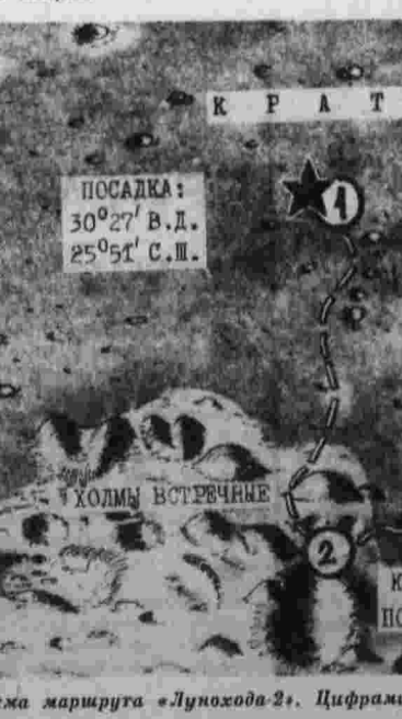
Схема маршрута «Лунохода-2». Цифрами отмечены места ночевки аппарата.

В холмистой предматериковой зоне луноход достиг высшего склона вала двухкилометрового кратера. При этом вблизи одного из кратеров диаметром 15—20 метров были обнаружены оползневые террасы протяженностью до 10—15 метров.