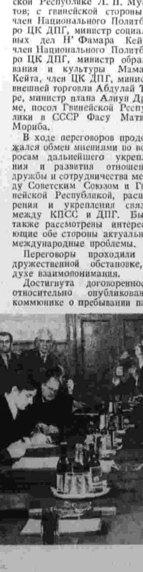
Во время переговоров.