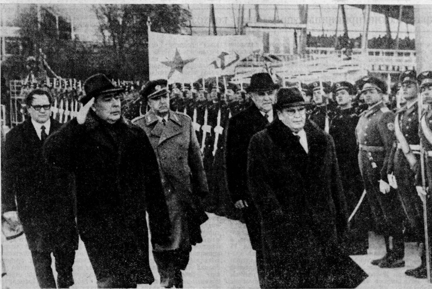
Проводы И. Броза Тито в Бориспольском аэропорту.

Член Политбюро ЦК КПСС, Председатель Совета Министров СССР А. Н. Косыгин возвратился 15 ноября из столицы Белоруссии в Москву.