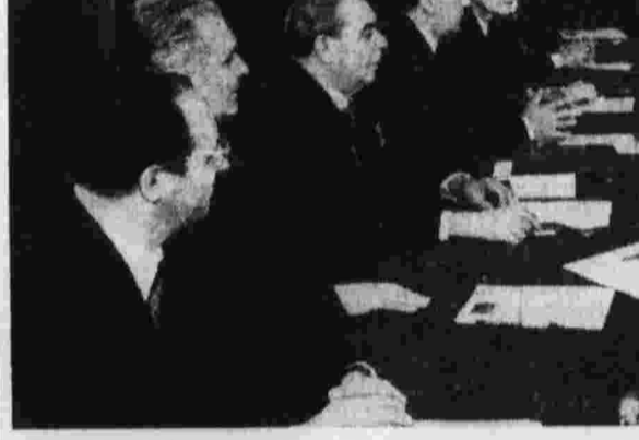
Во время переговоров.

В духе товарищества и взаимопонимания были рассмотрены актуальные проблемы двусторонних отношений в области политического, торгового-экономического, научно-технического и культурного сотрудничества.