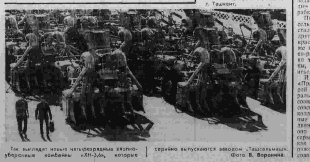
Так выглядят новые четырехрядные хлониборные комбайны «ХН-3,6», которые серийно выпускаются заводом «Ташсельмаш».