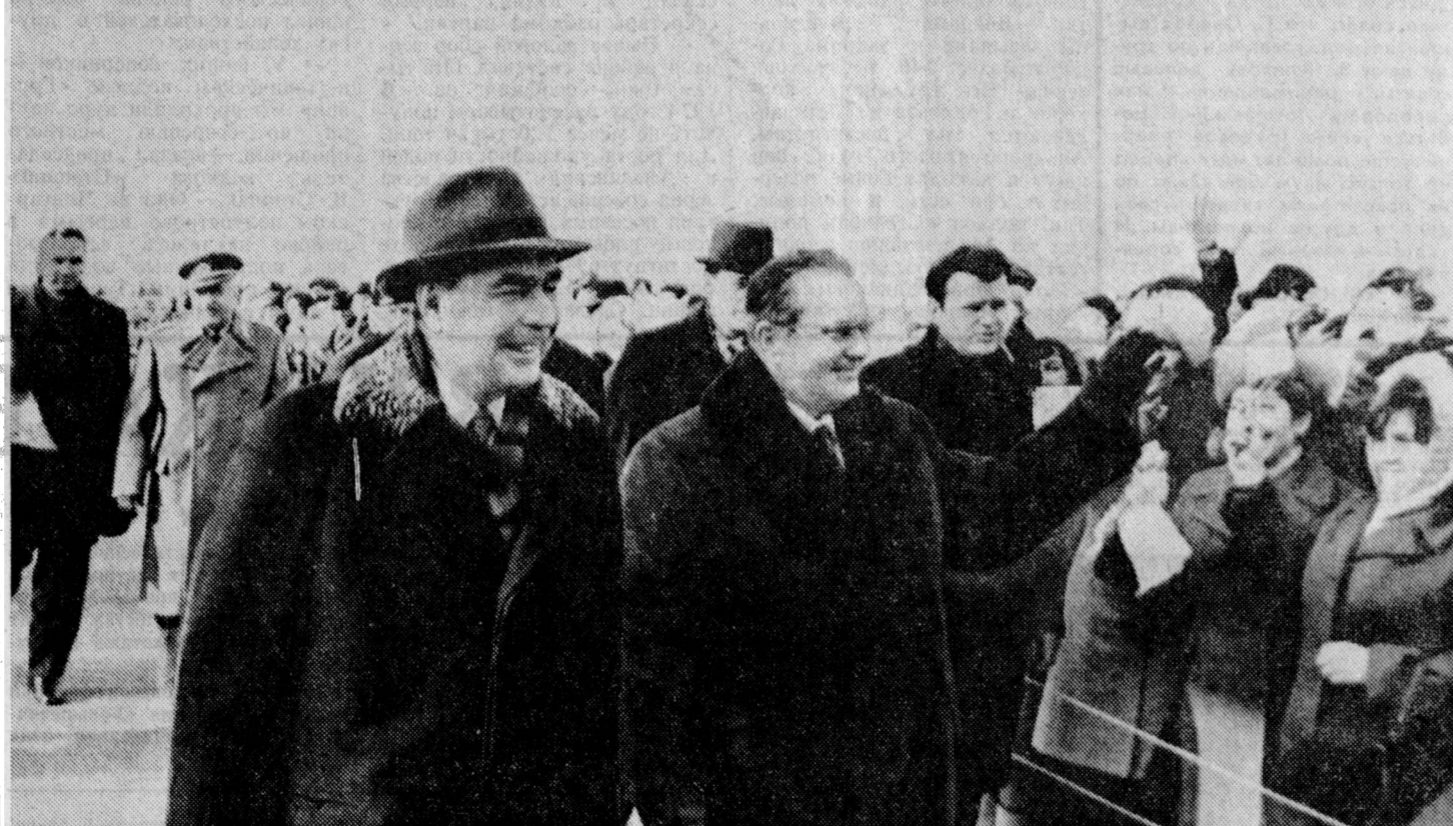
Встреча в Бориспольском аэропорту.

Улицы и площади Киева, по которым следовал кортеж автомашин, были украшены государственными флагами СФРЮ, СССР и УССР, приветственными транспарантами: «Добро пожаловать, дорогие югославские друзья!», «Да здравствует советско-югославская дружба!», «Братский привет народам Социалистической Федеративной Республики Югославии!». Сотни тысяч киевлян сердечно приветствовали товарищей Л. И. Брежнева и Иосифа Броз Тито. (ТАСС).