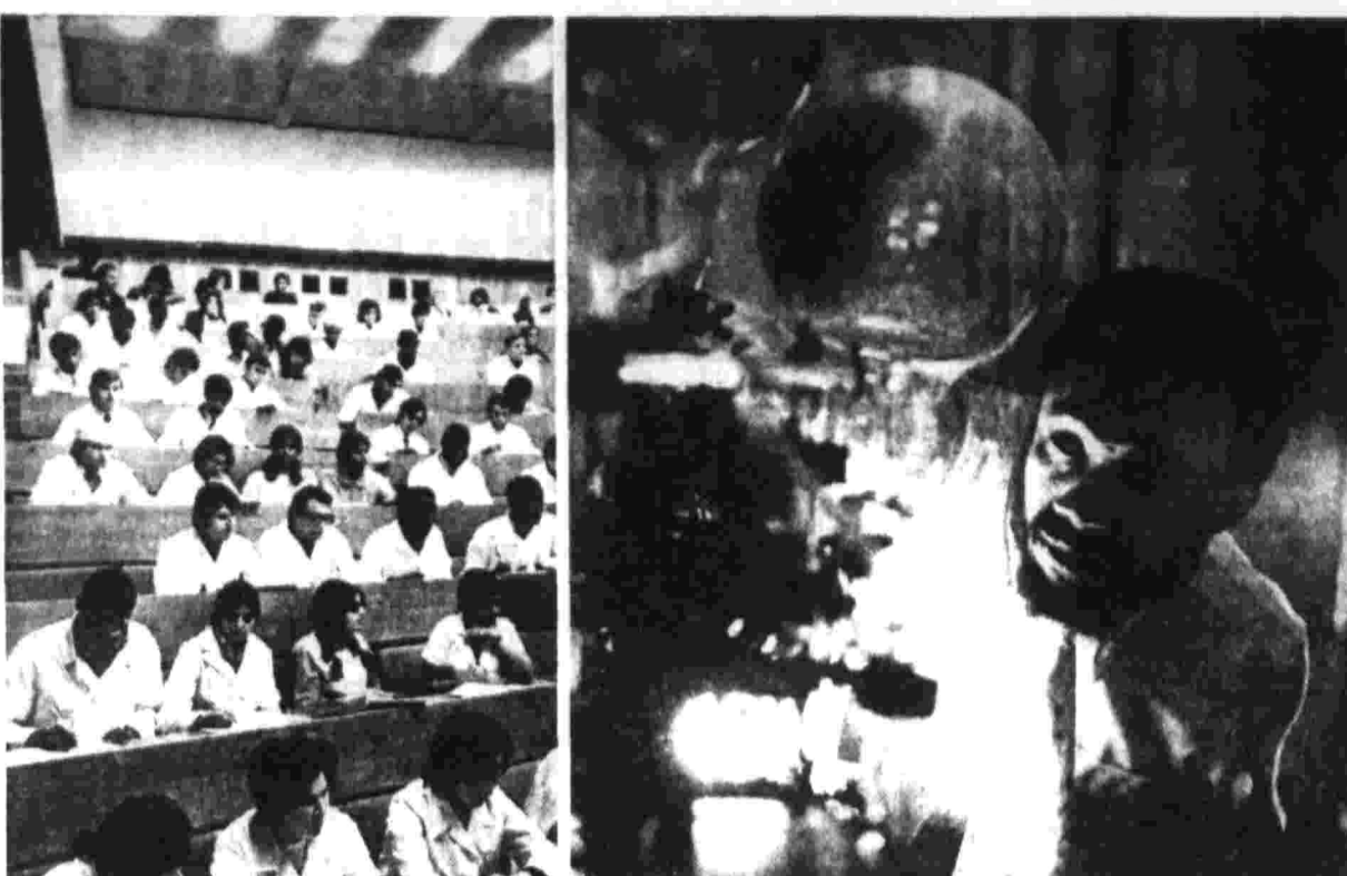
Сегодня — Всемирный день молодежи. Вместе с юношами и девушками нашей страны его отмечают и студенты Университета дружбы народов имени Патриса Лумумбы.