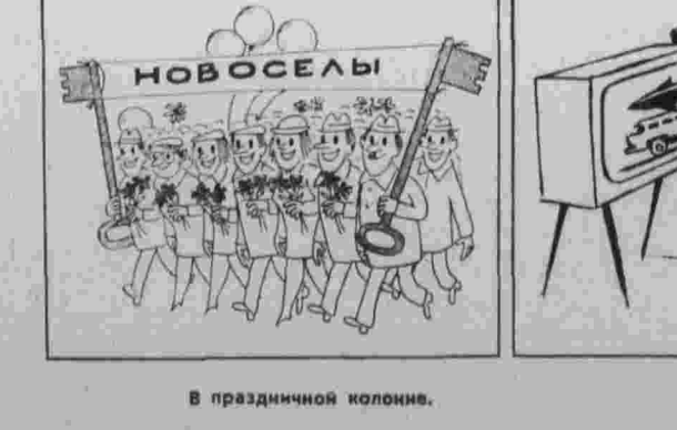
В праздничной колонне. Без слов.