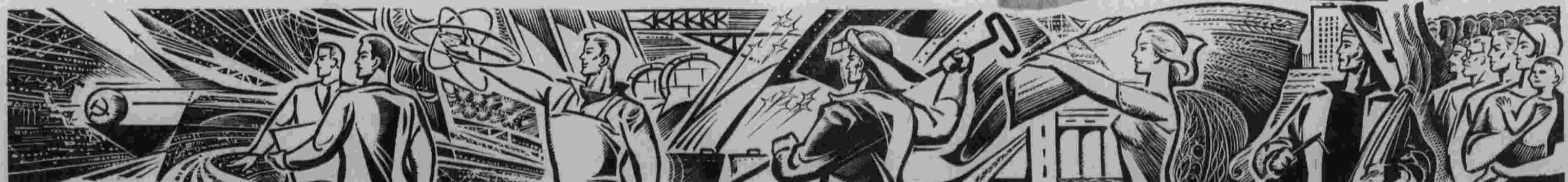
Плакат художника В. Лурия.

Председатель Президиума Верховного Совета СССР Н. ПОДГОРНЫЙ. Секретарь Президиума Верховного Совета СССР М. ГЕОРГАДЗЕ. Москва, Кремль, 5 ноября 1973 года.