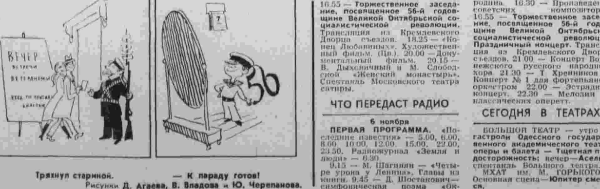
Рисунки Д. Агаева, В. Владова и Ю. Черепанова.