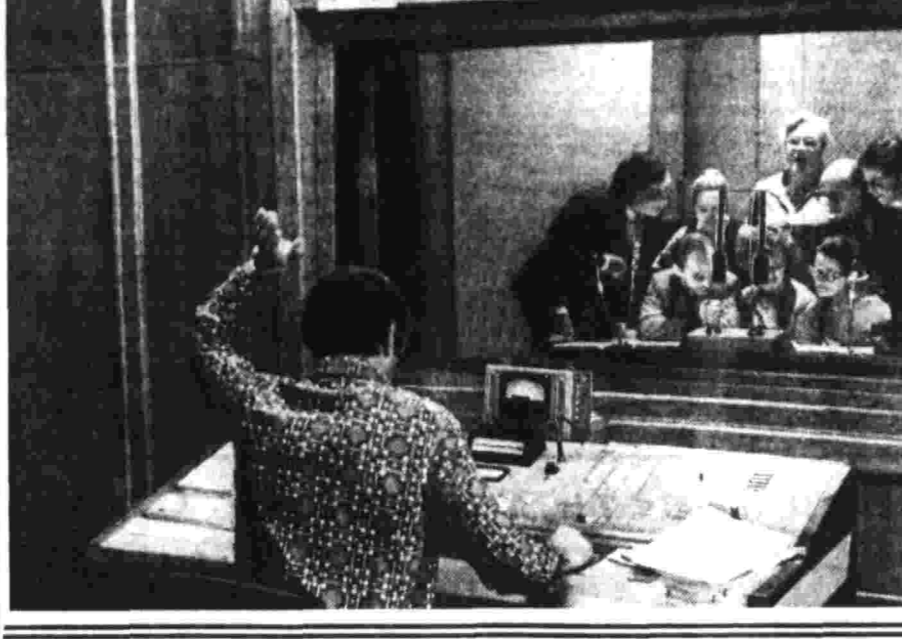
В это воскресенье проведут еще одну, предпринятую радиопередачу «С добрым утром!»