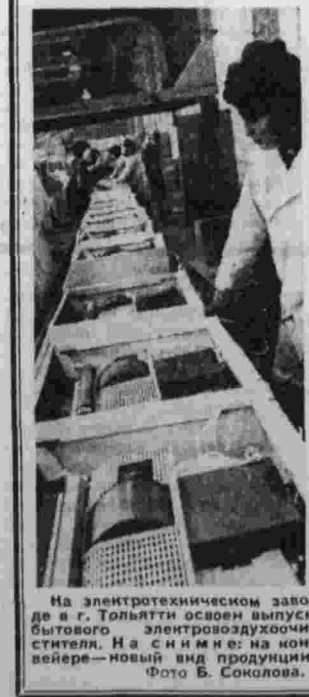
На электротехническом заводе в г. Толмачи освоил выпуск бытового электровоздушного средства. На с ним в неон-светере — новый вид продукции.

Нальчик, 3. (Внештатный корр. «Правды» П. Яковлев). Принца лейтенанта Г. Бутманова был кратким: — Поедете со мной на обозревательские оставшиеся, со временем войны фашистской бомбы.