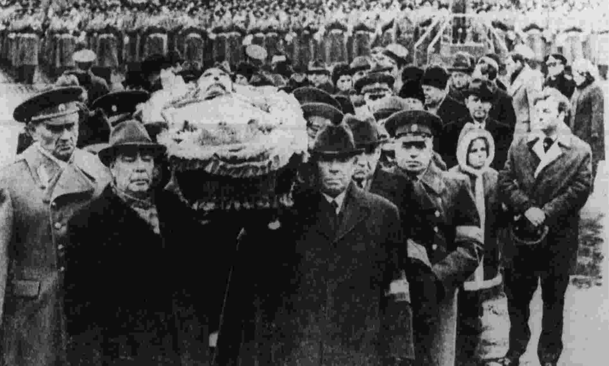
Руководители партии и правительства несут гроб с телом Семена Михайловича Буденного к Кремлевской стене.