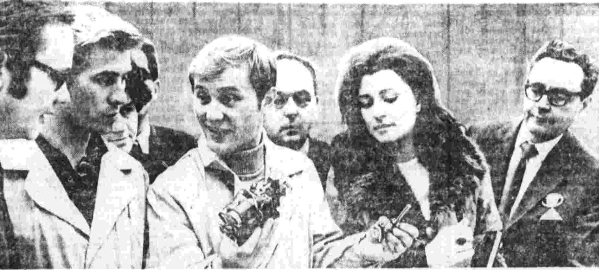
Теплая встреча с участниками Всемирного конгресса миролюбивых сил состоялась на московском заводе «Калибр».