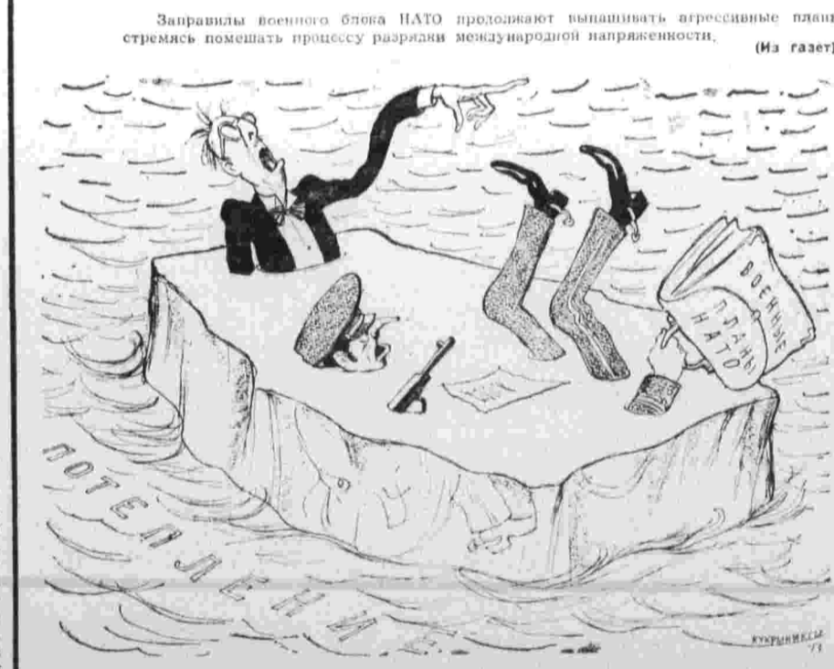
На льдине холодной войны.

«ФАБРИКА» БЕЛКОВ. АДНС-АБЕБА, 30. (Соб. корр. «Правды»). Проблема белкового голодания населения — явление типичное для многих африканских стран. Нехватка белков ведет к многим хроническим заболеваниям, сокращению жизни. И вот ученые, исследовавшие около 10 тысяч видов и сортов зерновых культур, обнаружили, что два сорта сорго, выращиваемые в Африке, содержат втрое больше белка, чем обычные злаки. Ученые предположили широко внедрять в посевы эти сорта сорго, что позволило бы значительно увеличить количество белков, потребляемых населением, испытывающим белковую голодную жажду. В. КОРОВИКОВ.