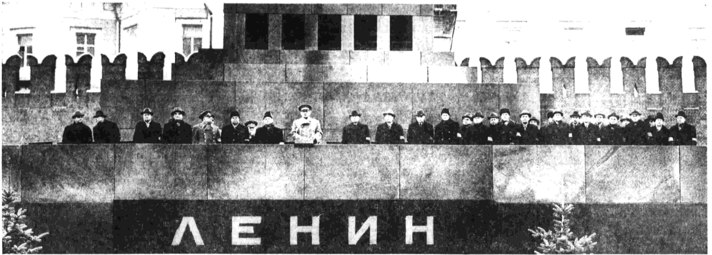
Москва, 30 октября 1973 года. Траурный митинг на Красной площади. На трибуне Мавзолея В. И. Ленина.

Вчера на Красной площади в Москве состоялись похороны Маршала Советского Союза Семена Михайловича Буденного. Страна проводила в последний путь выдающегося полководца, прославленного героя гражданской и Великой Отечественной войн.