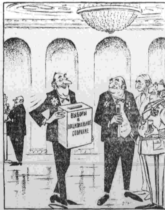
Рис. Д. Агаева.

Прекрасным примером возможности советско-западногерманских взаимовыгодных связей и кооперации, отметил собеседник, является значительная нагрузка поставок в ФРГ советского природного газа. Когда речь только шла об этой области, некоторые члены экспертной группы в ФРГ части производимой электроэнергии. Интересные могут оказаться также и трансграничные формы сотрудничества Советского Союза, ФРГ и Ирана в области природного газа.