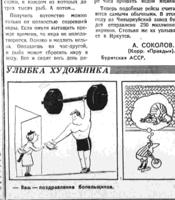
— Вам — поздравления болельщиков. Без слов. Капитуляция.