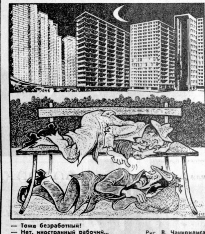
— Также безработный! — Нет, иностранный рабочий... Рис. В. Чакиридиса.

Иностранцы рабочие, приезжающие в поисках заработка в страны Западной Европы, являются совершенно несчастными и живут в ужасающих условиях. (Из газет.)