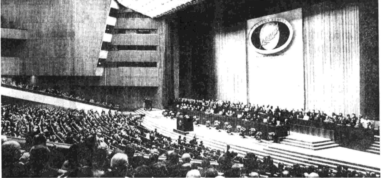
Москва, Кремлевский Дворец съездов. Открытие Всемирного конгресса миролюбивых сил.