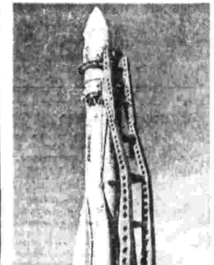
В Государственном музее истории космонавтики имени К. Э. Циолковского в Калуге установлена ракета «Восток» — первая советская ракета, вышедшая на орбиту Земли космическим кораблем Ю. А. Гагарина.

Во время перехода на промыслах в Атлантике советский рыболовный траулер «Сиваш» принял сигнал бедствия. Его подавало находящееся поблизости груженное лесом либерийское судно «Денгузла Каррен» (порт приписки Монровия). Начавшийся пожар охватил уже жилую надстройку судна и создал угрожающую обстановку.