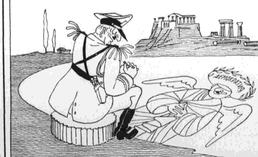
ОБМАН ЗРЕНИЯ. Рис. В. Тильяма.

Реакционная греческая военщина хотела бы под маской «либерализации» сохранить в стране антидемократический режим. (Из газет.)