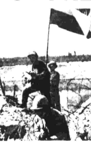
Участок египетско-израильского фронта. Египетский флаг на берегу Суэцкого канала. Фотохроника ТАСС.

Телевизионная станция «Бей-э-ти-ви» в Лигте Роке (штат Арканзас) объявила, что «близлежащее военно-воздушное базис в Израиле направляло множество ракет, бомб и других видов вооружений. Ежедневно на базу приземляются израильские транспортные самолеты «Боинг-707» и «Боинг-747», которые поштеном загружаются вооружением и отбывают на Ближний Восток. Киновороты станции удалось заснять стоящие под погрузкой самолеты с израильскими опознавательными знаками на борту. Кроме того, вооружение в Израиль