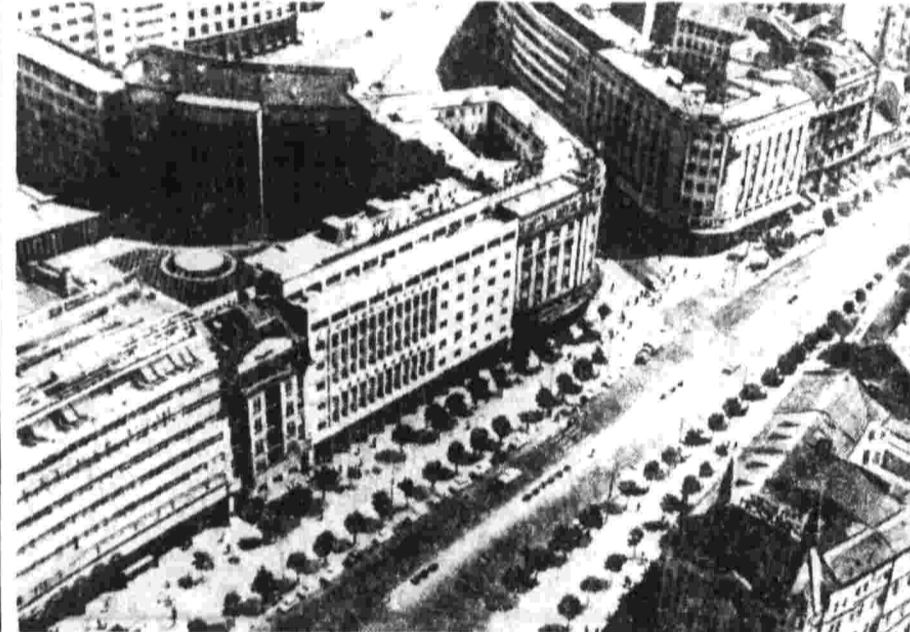
Здание ЦК КПЧ в Праге.