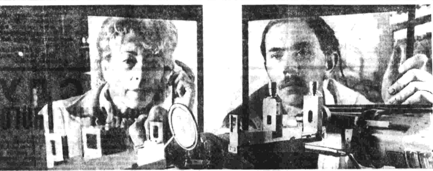
В Институте прикладной физики Академии наук Молдавской ССР совершенствуются и создаются принципиально новые процессы и методы, которые охватывают область обработки металлов, энергетик, химии, биологии, пищевой промышленности и сельского хозяйства.

количество подменный фонд медицинской аппаратуры, не всегда высоко ее качество. Затягиваются сроки ремонта. Занулева в метрологической службе. Как-то областное управление «Медтехника» решило проверить состояние измерительных приборов в больницах и поликлиниках — более половины оказались неисправными.