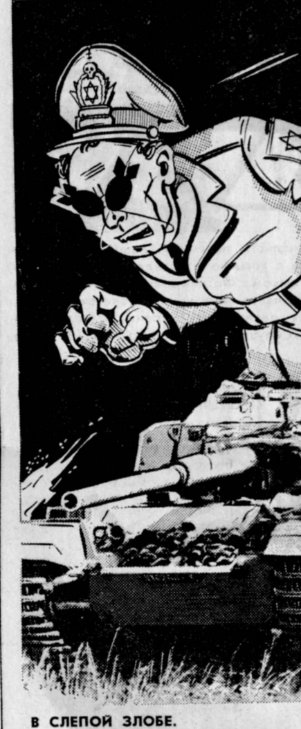
Продолжая политику агрессии, насилия и разбоя, Тель-Авив подвергает бомбардировкам и обстрелам гражданское население соседних арабских государств. (Из газет)

Министр сообщил членам парламента, что, по мнению правительства Англии, резолюция Совета Безопасности ООН № 242 «все еще предлагает наилучшую возможность урегулирования положения на Ближнем Востоке». А. Дуглас-Хьюм напомнил, что английское правительство после возобновления военных действий на Ближнем Востоке призвало к «немедленному прекращению огня» и «простоавило все поставки оружия» воюющим сторонам. (ТАСС, 17).