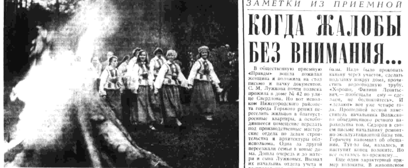
Фотоконкурс «Правды» В. ЯКОБСОН (г. Рига). «Мостер дружок» и «Солнцето».

Я не знаю — весны сегодня маду. (Перевел Юрия РИШЕЛЕР)