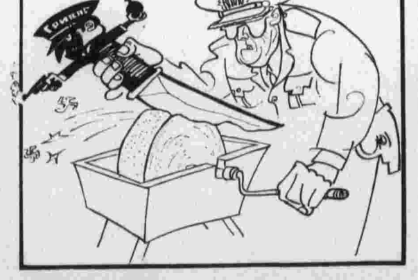
НАТОВСКОЕ ОРУЖИЕ. Рис. М. Литвина (г. Харьков).

Р. Никсон высказался против законодательства, «которое закрывало бы американские рынки или возводило барьеры на пути иностранных товаров».