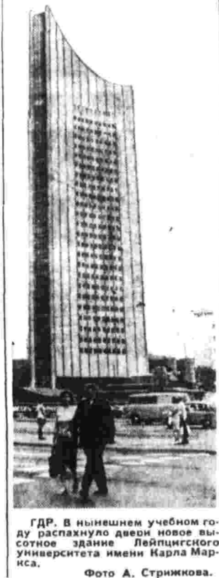
ГДР. В нынешнем учебном году распахнуло двери новое высшее учебное заведение имени Карла Маркса.

Благодаря этой кооперации объединяются средства, инженерно-конструкторские силы машиностроителей, создается высокая степень разделения труда и специализации, что позволяет со временем обеспечить выпуск больших серий сельскохозяйственных машин. Предусмотрен выпуск колесных тракторов от полтона до 150 лошадиных сил, мотокальтиваторов, полевых, садовых и огородных прицепных орудий. Более 1 миллиарда динаров предполагается выделить на финансирование этой программы. Оснащение современным оборудованием и внедрение прогрессивной технологии позволяют резко повысить производительность труда и обеспечить высокую рентабельность. Уже в 1975 году с конвейера объединения сойдет свыше 11 тысяч тракторов.