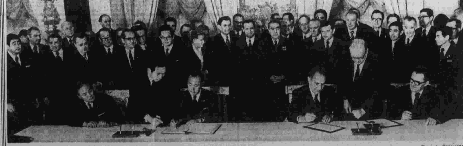
Москва, Кремль. 10 октября 1973 года. Подписание советско-японских документов.

Первый секретарь Центрального Комитета Социалистической единой партии Германии Хорст ЗИНДЕРМАН, Председатель Совета Министров Германской Демократической Республики Борт самолета, 10 октября 1973 года.