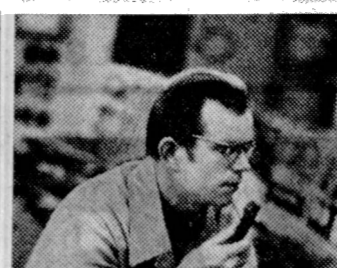
На Костромской ГРЭС сдан в эксплуатацию восьмой энергоблок. Тем самым завершена эта крупнейшая станция.