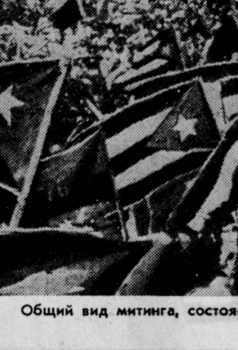
Общий вид митинга, состоявшегося 29 сентября в Гаване.

Делегация, кроме Москвы, посетила Белорусскую ССР и г. Калинин, имела встречи и беседы в Международном отделе ЦК КПСС, в Госкомитете Совета Министров СССР по науке и технике, в ЦК КП Белоруссии и в Калининском обкоме КПСС, побывала на промышленных предприятиях и в колхозах, ознакомилась с мерами, принимаемыми по охране окружающей среды и защите природы в Советском Союзе.