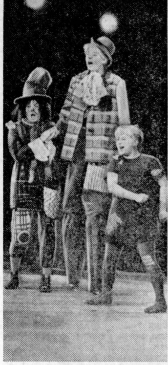
После успешных гастролей в Ташкенте начал свой пятнадцатый сезон Московский театр оперы...