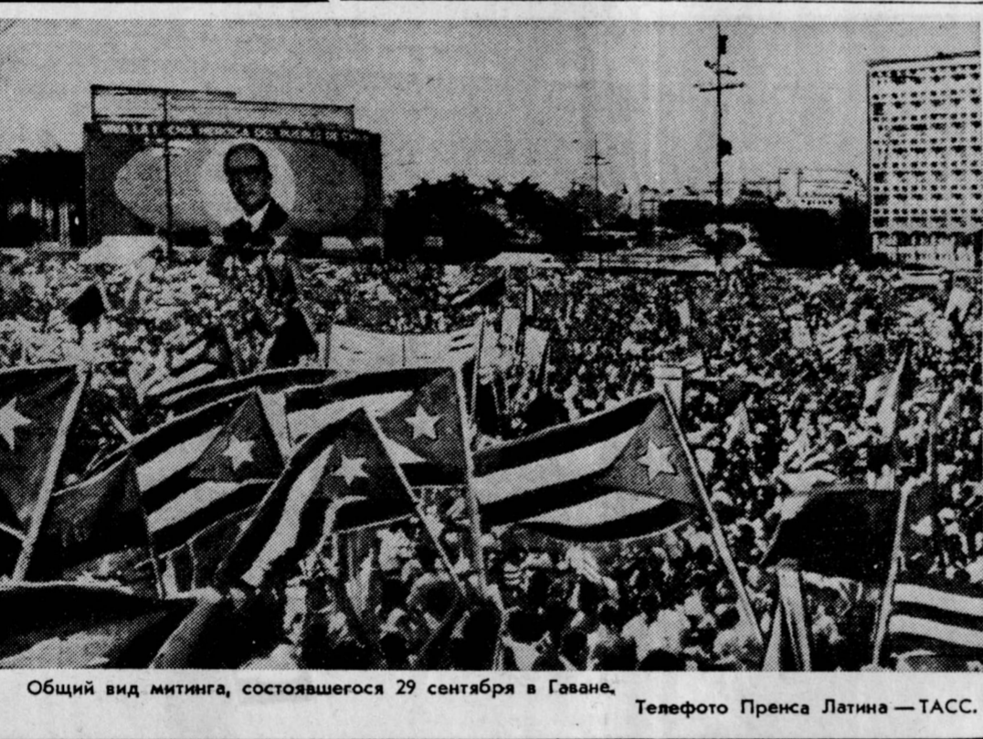
Общий вид митинга, состоявшегося 29 сентября в Гаване.

Совершенно очевидно, сказал Ф. Кастро, что империализм предпринимает стратегическую атаку в Латинской Америке. Со-