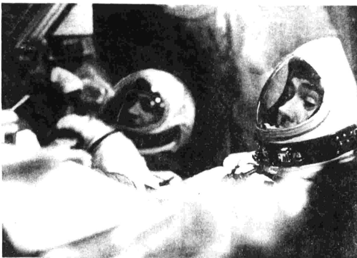
Экипаж космического корабля «Союз-12» Василий Григорьевич Лазарев и Олег Григорьевич Макаров на тренировке.

Ударная вахта земледельцев продолжается. Они стремятся с честью выполнить социалистические обязательства третьего года пятилетки, которым предусмотрено дать стране больше овощей, картофеля и фруктов.