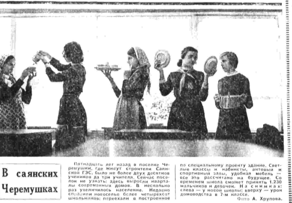
В саянских Черемушках

Пятнадцать лет назад в поселке Черемушки, где жила строители Саянской ГЭС, было не более двух десятков учеников в трех классах. Сейчас поселок не узнать: здесь выросли кварталы современных домов. В неосвоенной уже территории поселка. Недавно специально построены четыре школы: переделаны в построенные по специальному проекту здания. Светлые классы и кабинеты, автобусы и спортивные залы, удобная мебель — все это радует глаза на будущее. Сейчас в школе обучается 1.230 мальчиков и девочек. На с ними и их слеза — у новой школы; сверху — урон домохозяйства в 7-м классе.