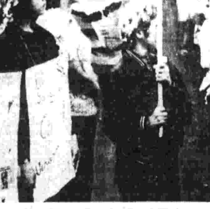
Фотосъемка в ходе митинга в Париже.

ПАРИЖ, 25. (ТАСС). В связи с проведением 23 сентября во Франции первого тура кантональных выборов Французская коммунистическая партия и другие левые партии опубликовали совместное заявление, в котором выражены уверенность в успехе левых сил. Это заявление, говорится в нем, свидетельствует о широкой народной поддержке совместной правительственной программы левых сил.