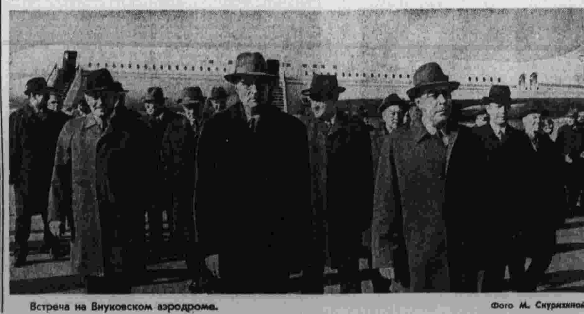
Встреча на Внуковском аэродроме.