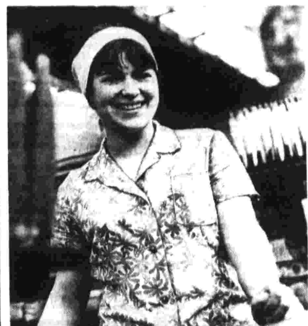
Народная Республика Болгария занимает одно из первых мест в мире по темпам экономического развития. В первых рядах строителей нового общества — юноши и девушки, слесари в рядах Димитровского коммунистического союза молодежи.

Ветры разрушают верхний слой почвы на островах, и урожайность огурцов и моркови резко падает. Нельзя найти средство для того, чтобы помешать ветровой эрозии?