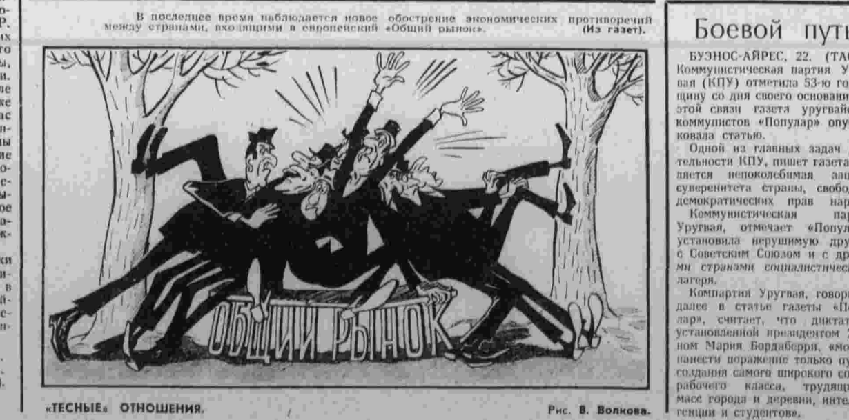
«ТЕСНЫЕ» ОТНОШЕНИЯ. Рис. В. Волков.