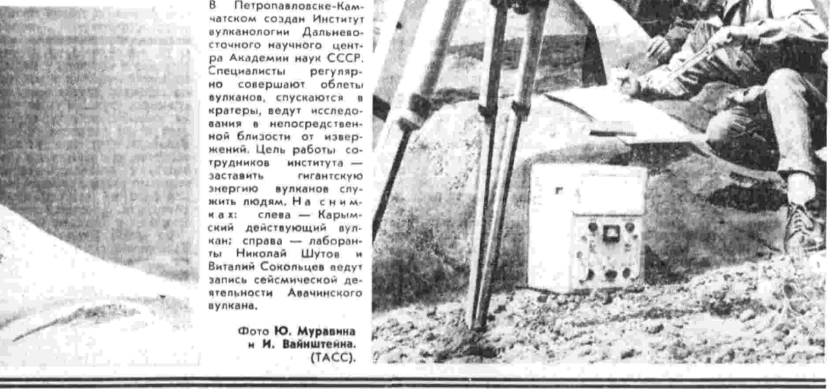
Тако изучают вулканы. Недр Камчатка — это гигантская кипучая масса, прикрытая коркой земли.