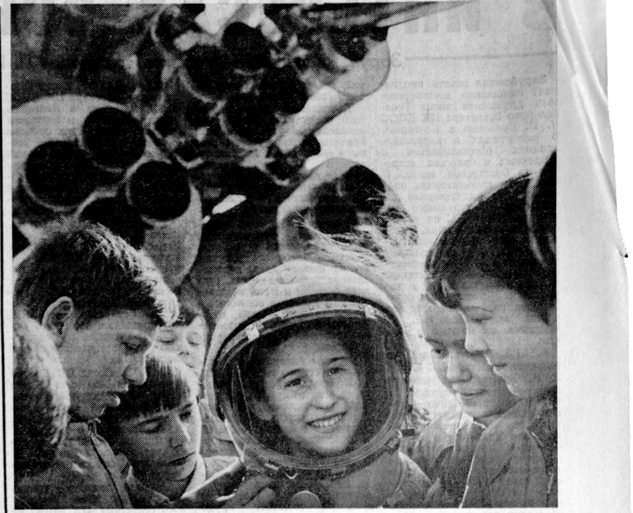
В калужской школе № 9 имени К. Э. Циолковского, где в свое время учительствовал великий ученый, созданный музей космонавтики. Его активисты — члены группы учеников — сотрудники Центрального музея истории космонавтики. На снимке: примерка настоящего космического шлема.

В настоящее время в мире уже достигнуты в СССР, США, Франции, Англии, в Советском Союзе уже действуют опытные АЭС в Димитровграде (Ульяновская область), недавно вступила в строй крупнейшая в мире АЭС такого типа в г. Шевченко.