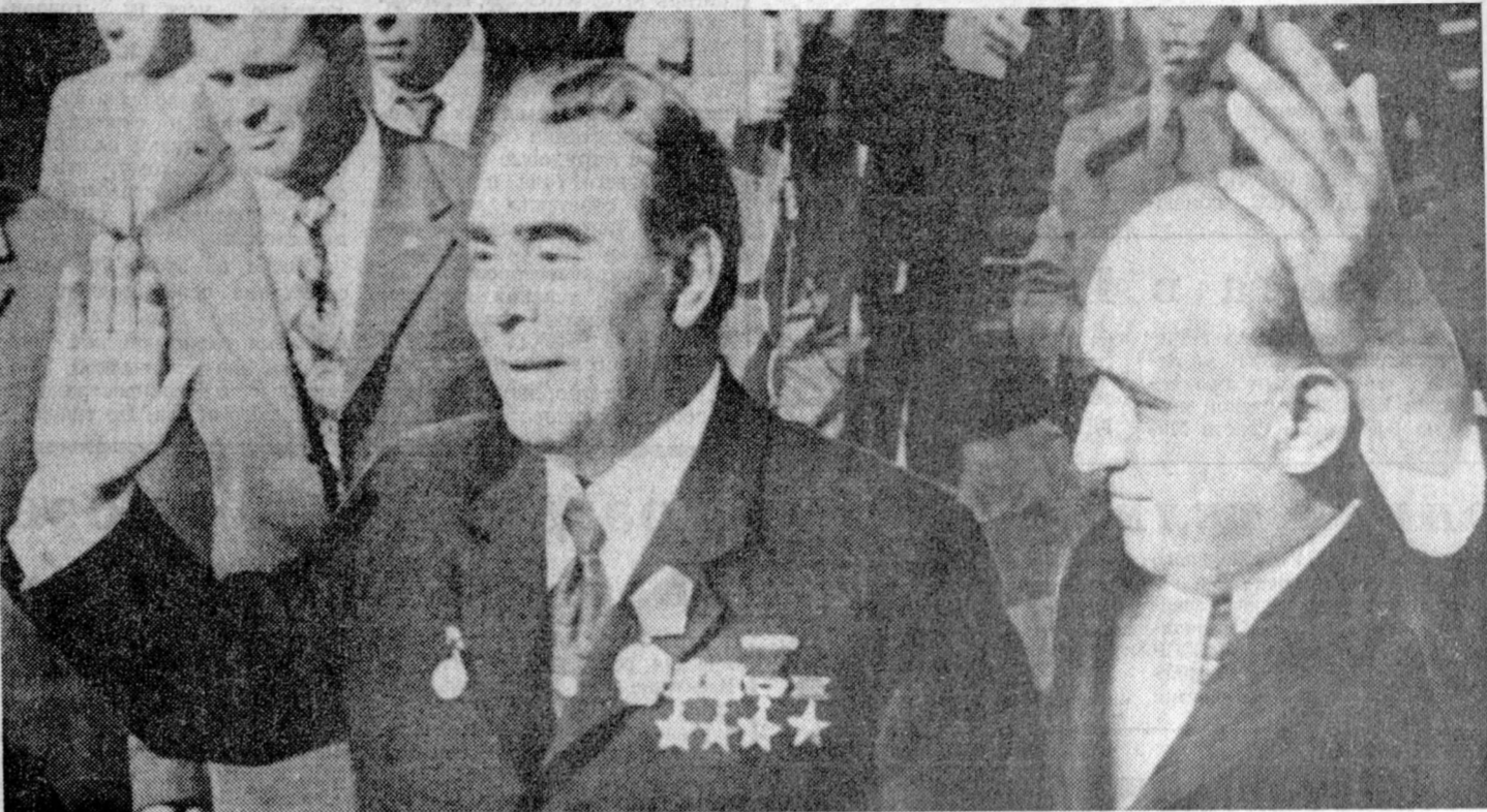
Проводы в Софийском аэропорту.