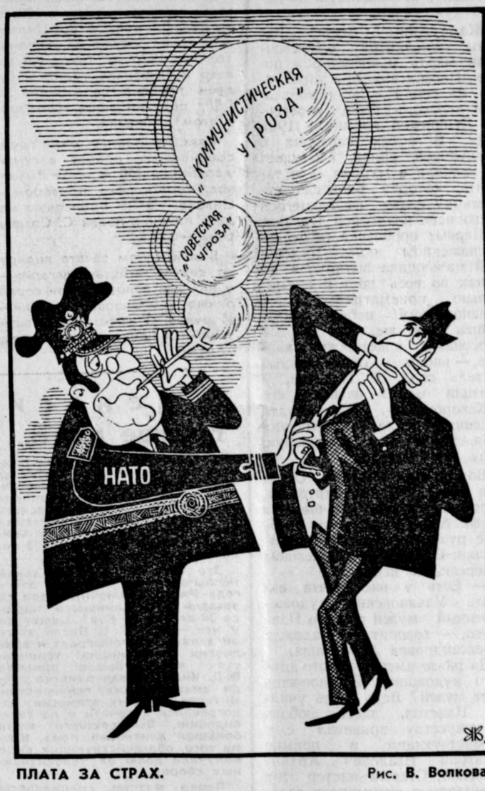
ПЛАТА ЗА СТРАХ. Рис. В. Волкова.

ностью этой группы лиц, которая захвачена со всеми документами и компрометирующими их материалами. Агентство Бахтар отмечает, что в числе арестованных был бывший премьер-министр М. Х. Мейвандал, губернатор Наггархарской провинции Хан Мухаммед, командующий ВВС генерал Абдул Резак и другие лица. Обстановка в Афганистане остается нормальной. Армейские подразделения, верные республиканскому строю, говорится в сообщении, контролируют положение в столице и других городах страны.