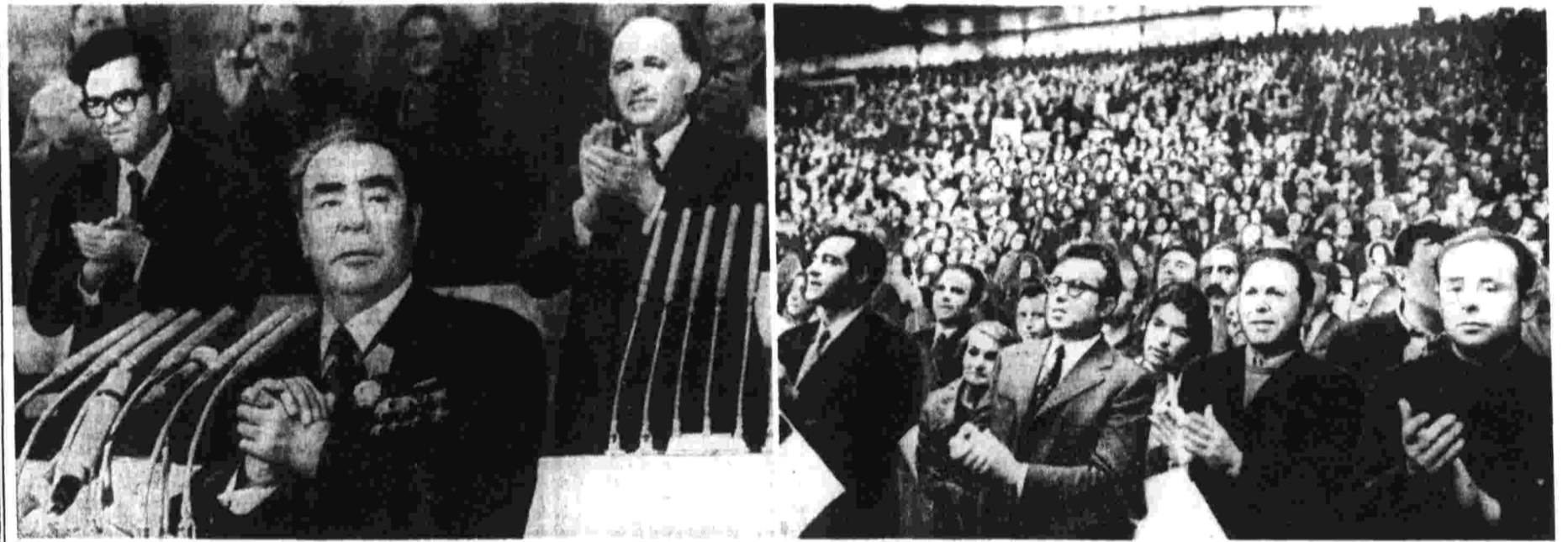
Митинг трудящихся Софии. На трибуне — Генеральный секретарь ЦК КПСС товарищ Л. И. Брежнев.