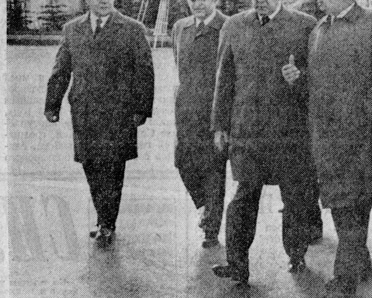
Проводы на Внуковском аэродроме.

На Внуковском аэродроме, украшенном государственными флагами СССР, товарища