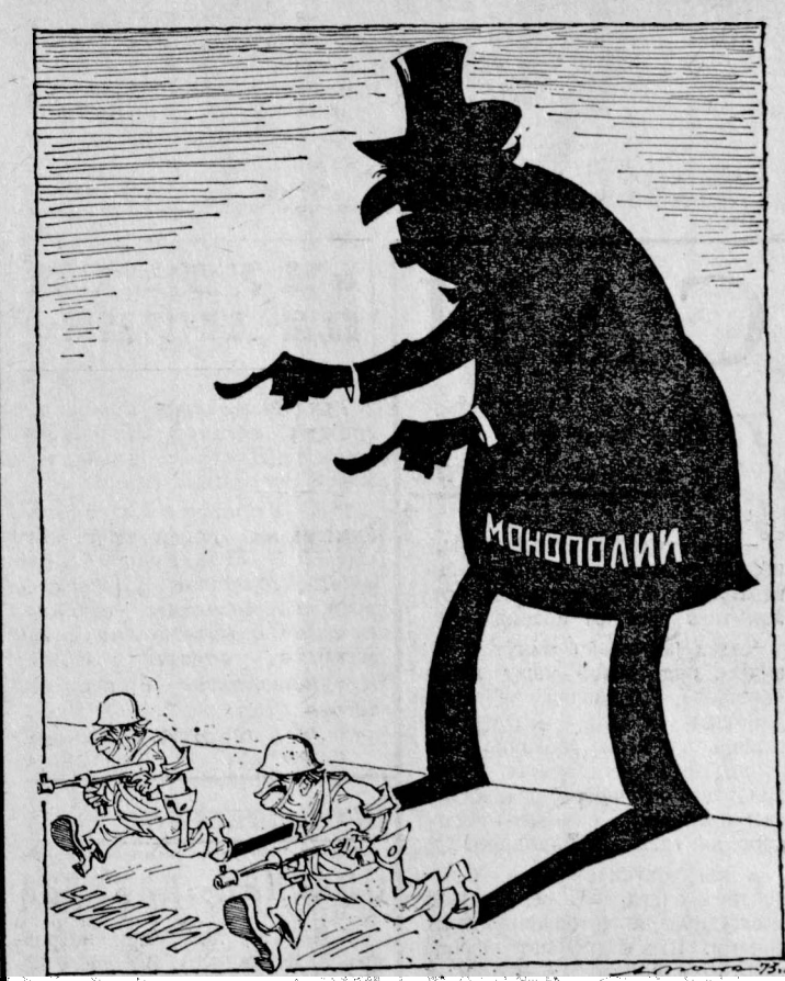
НАПРАВЛЯЮЩАЯ СИЛА ПУТЧИСТОВ. Рис. М. Абрамова.

в результате заключенного в ходе недавнего визита Генерального секретаря ЦК КПСС Л. И. Брежнева в США исторического по своему значению советско-американского Соглашения о предотвращении ядерной войны. Процесс разрядки вовлекает в себя все большее число стран, захватывая все более важные области отношений между ними. Способствовать беспрепятственному развитию и дальнейшему углублению этого процесса, создавая условия, чтобы он приобрел необратимый характер, — важнейшая задача, в решение которой должны внести свой вклад все государства. Что касается Советского Союза — неизменного и целесообразного поборника коренного оздоровления международной обстановки, то он намерен, как и раньше, активно действовать в этом направлении, проявляя инициативу, изыскивая новые пути и подходы, подчеркнул А. А. Громыко. Именно такая цель поставлена перед советской делегацией, прибывшей в Нью-Йорк для участия в XXVIII сессии Генеральной Ассамблеи ООН. А. А. Громыко передал привет и добрые пожелания жителей г. Нью-Йорка. В тот же день в Нью-Йорк прибыли делегации Украинской ССР во главе с министром иностранных дел СССР Г. Г. Шевченко и Белорусской ССР во главе с министром иностранных дел БССР А. Е. Гуриновичем.