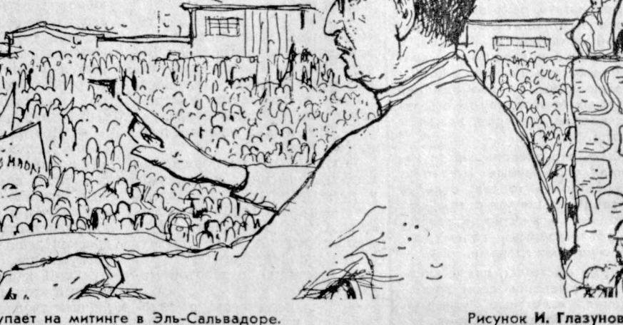
С. Альенде выступает на митинге в Эль-Сальвадоре. Рисунок И. Глазунова.