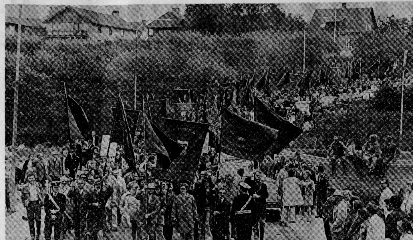
Трудящиеся Дании не прекращают борьбу за повышение заработной платы, улучшение условий труда, против ущемления прав профсоюзов.

На снимке: массовая демонстрация рабочих в городе Хадсуне.