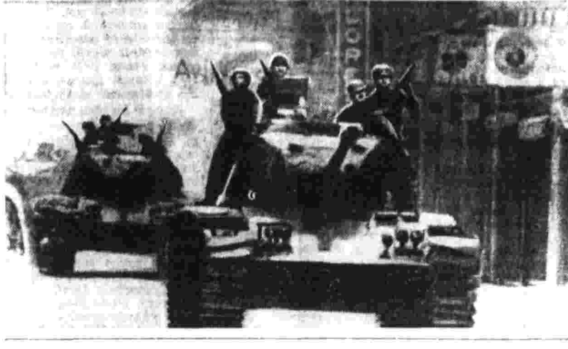
На снимке: танки мексиканской армии на улицах Сантьяго. Фотохроника ТАСС.

НЬЮ-ЙОРК, 13. (ТАСС). По сообщению информационных агентств из Чили, там продолжается вооруженное сопротивление силам военной хунты, свергнувшей 11 сентября законное правительство и захватившей власть в стране.