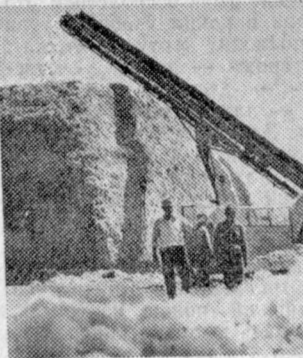
Заготовленные пучки приехали первые сотни тысяч тонн хлопка.