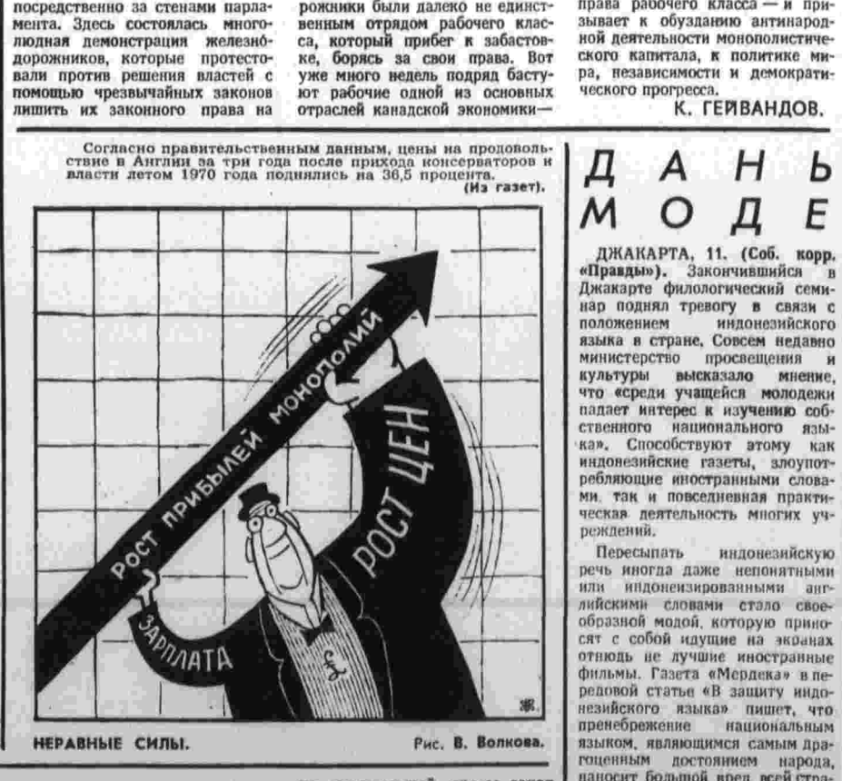
Рис. В. Волкова.

Расследова это дело, полиция установила, что в нем замешано много официальных представителей южнокорейских властей в Японии. Попытки полиции вызвать их для допроса оказались безуспешными. Как только в печать попадали сообщения о причастности очередного южнокорейского «дипломата» к похищению, он в спешном порядке уезжал в Сеул. Не увенчались успехом и официальные просьбы Японии к южнокорейским властям вернуть Кима и лиц, подозреваемых в причастности к похищению, в Японию для расследования дела. Сеул ответил решительным отказом.