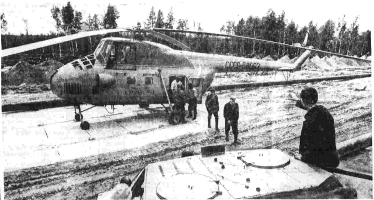
818-километровая стальная труба нефтепровода Александровско-Томск — Анжеро-Судженск диаметром 1,220 миллиметров пролегла с севера Томской области на юг, пересекая десятки больших и малых оек, озера, Васюганские и Икинские болота, вековую тайгу и буреломы. Служба эксплуатации нефтепровода постоянно следит за состоянием важной магистрали. На снимке: патрульная группа Александровской нефтеперерабатывающей станции перед выходом в очередной рейс-осмотр.