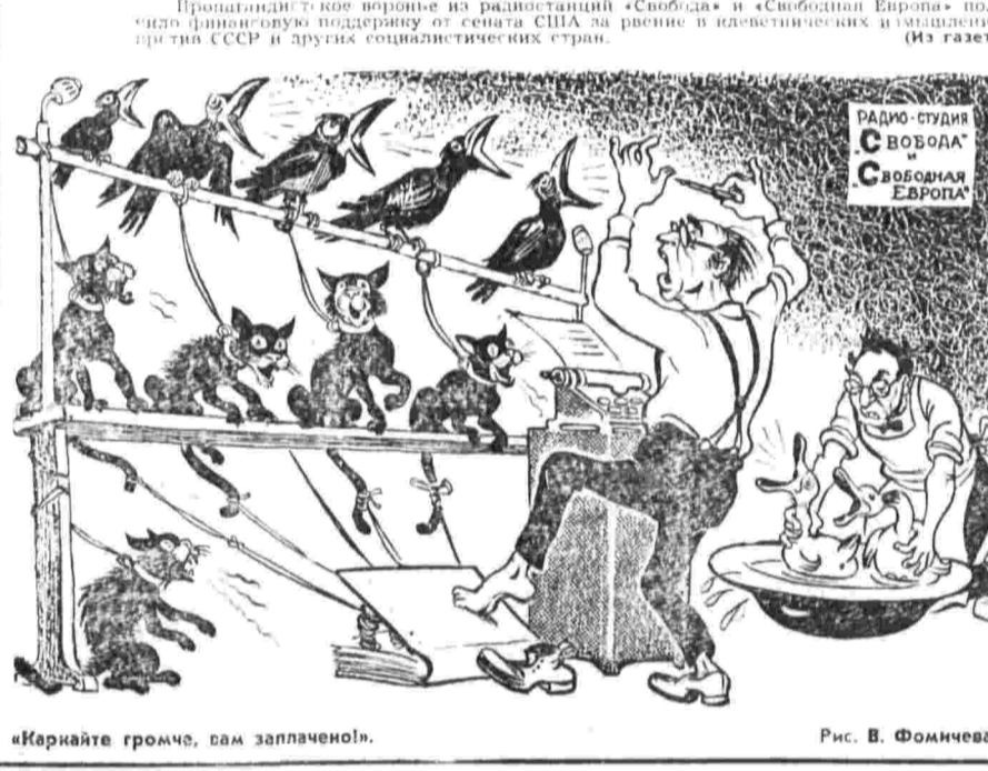
«Кричите громче, сам заплачет».