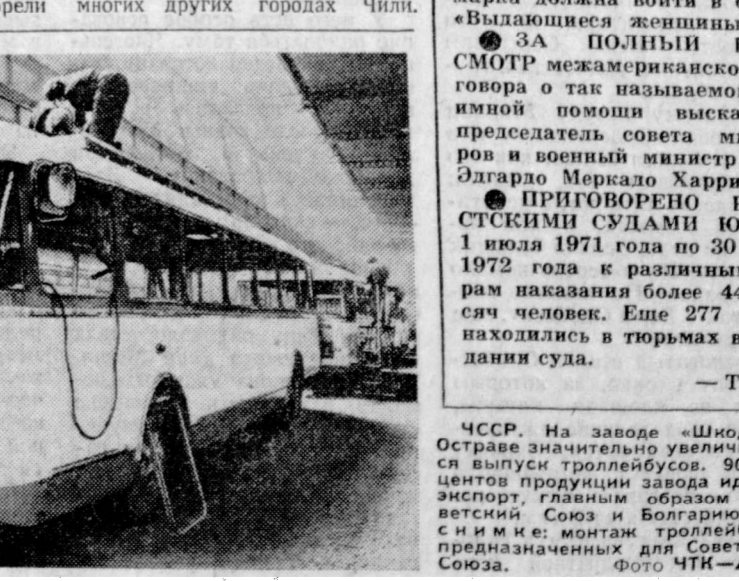
ЧССР. На заводе «Шода» в Острове значительно увеличился выпуск троллейбусов. 90 процентов продукции завода идет на экспорт, главным образом в Советский Союз и Болгарию. На снимке с. монтаж троллейбусов, предназначенных для Советского Союза.