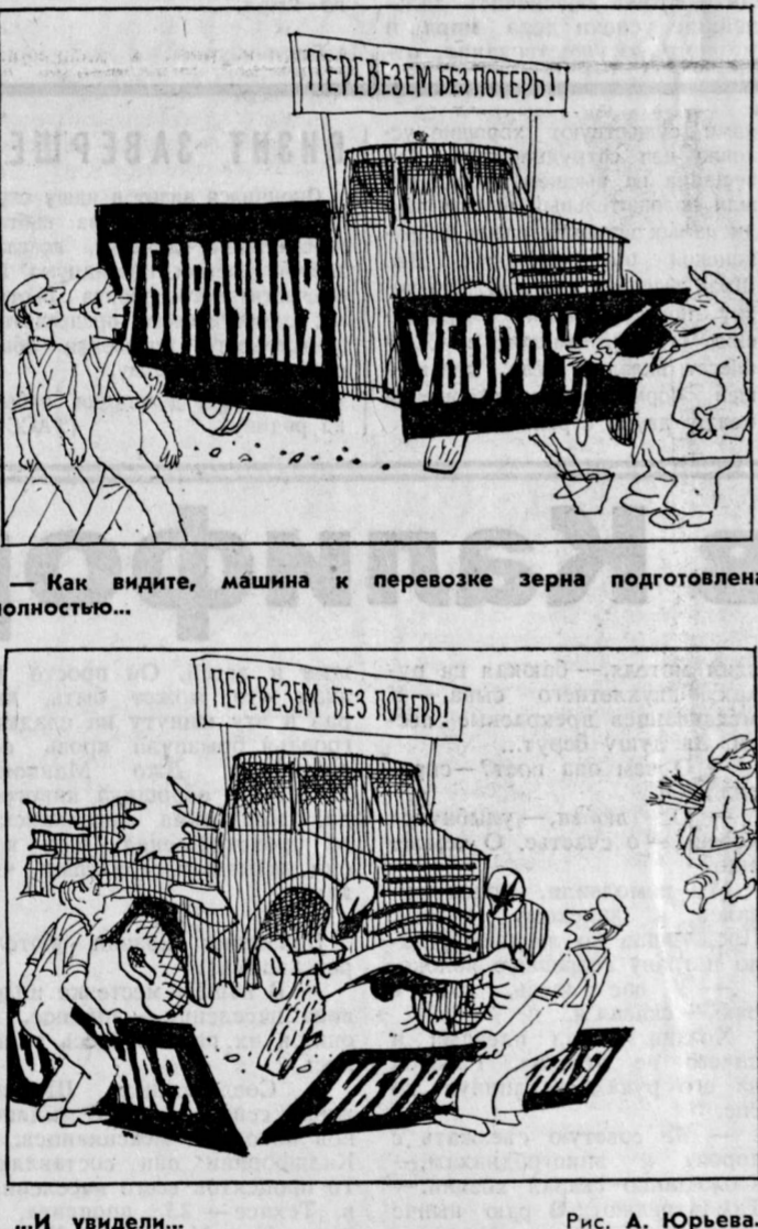
...Как видите, машина к перевозке зерна подготовлена полностью... ...И увидели... Рис. А. Юрьева.