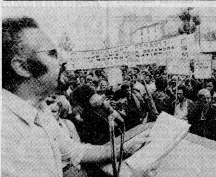
По всей Франции продолжается движение солидарности с рабочими завода «Рено»...

ПРАГА, 1. (ТАСС). Здесь опубликовано сообщение агентства ЧТК, в котором говорится, что 6-7 сентября Чехословакия должна была посетить канцлер ФРГ В. Брандт с целью подписания договора о взаимных отношениях между ЧССР и ФРГ. Однако правительство ФРГ в противоречие с четырехсторонним соглашением по Западной